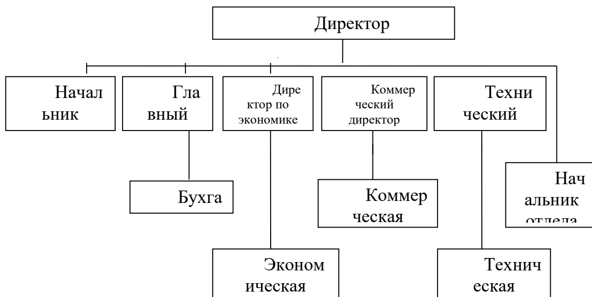
Рис. 1. Организационная схема ООО «Первая фирма»