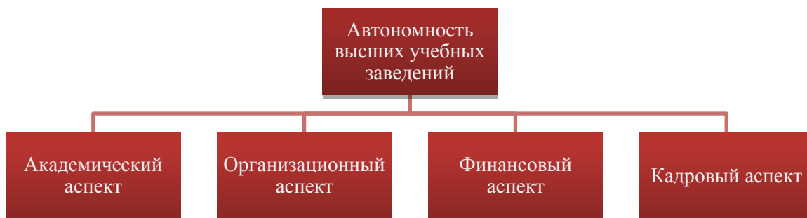
Рисунок 1 –Аспекты автономности высших учебных заведений [45, с. 36-51]

Автономность высших учебных заведений состоит из нескольких аспектов (рисунок 1).