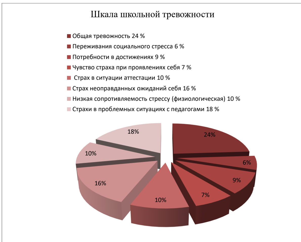
Рисунок 3 – Соотношение тревожности учеников 8 «А» и 8 «Б»

По результатам диагностики, представленным на рисунке 3, поясняем: