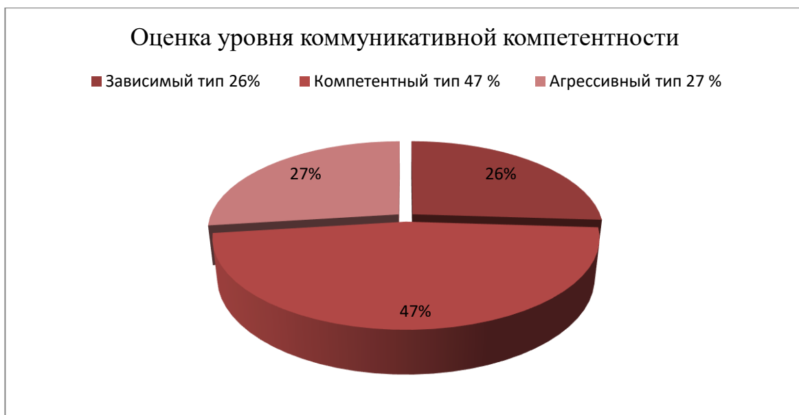
Рисунок 1 – Процентное соотношение оценки уровня коммуникативной компетенции учащихся 8 «А», «Б» классов

Полученные данные, обработанные с помощью «ключа». В результате у старшеклассников, представляющих большую часть испытуемых, превалирует компетентный тип реагирования на предложенные обстоятельства. Эти подростки способны адекватно реагировать на критику и комплименты в свой адрес; не испытывают затруднения при обращении за помощью к сверстникам, владеют навыками оказания сочувствия, поддержки; способны выражать симпатию, так как активны в понимании реакции собеседника и владеют возможностью использовать навыки речевой коммуникации.