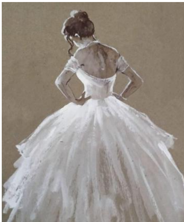
Рисунок Е.7 – Эскиз фигуры невесты в платье