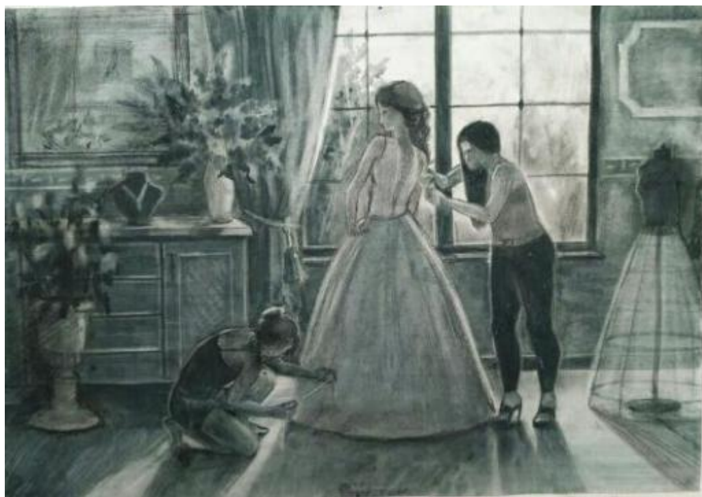
Рисунок А.1 –Картон к композиции «Свадебные хлопоты»