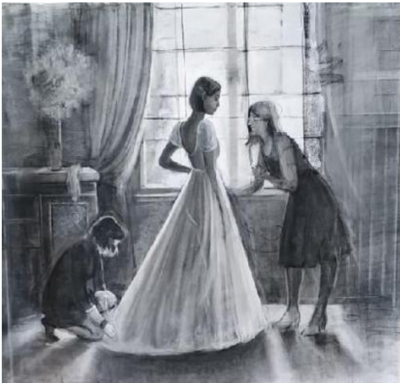
Рисунок Д.1– Эскиз к композиции