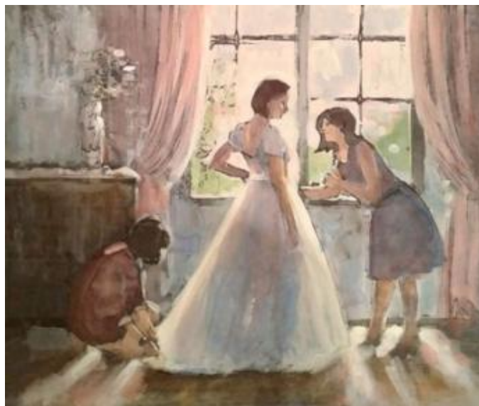
Рисунок Б.2 – Вариант цветового эскиза