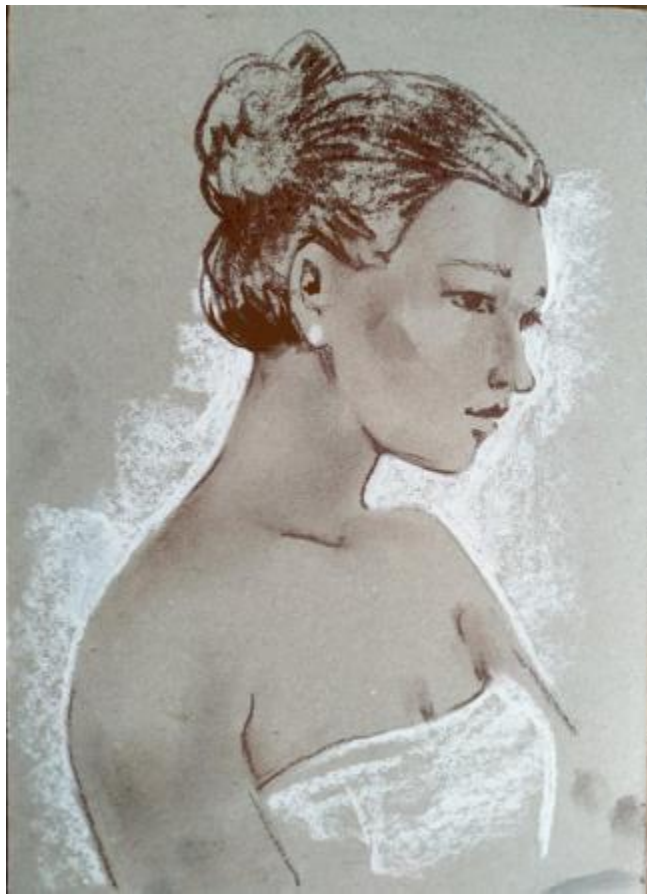
Рисунок Е.5 – Эскиз невесты