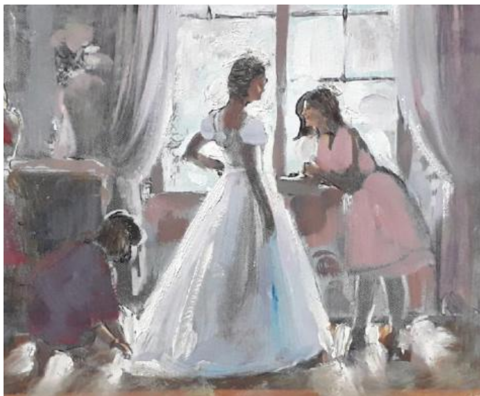
Рисунок Б.4 –Цветовой эскиз к композиции