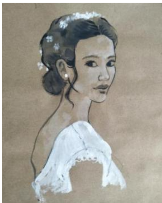
Рисунок Е.2 – Эскиз свадебной прически