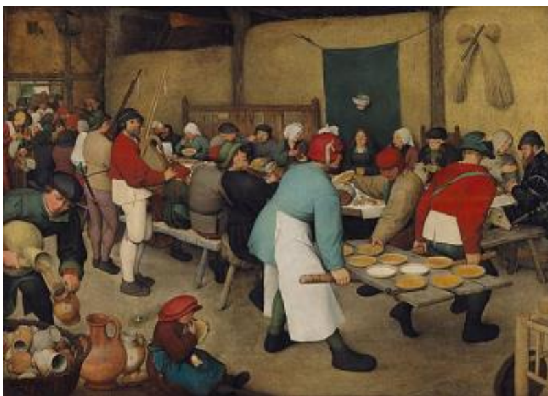
Рисунок 17 – Питер Брейгель старший, «Крестьянская свадьба», 1567 г.

Художника волнует не только атмосфера праздника крестьян, его интересуют и они сами. Брейгель пытается уловить их характер, черты лица, манеру поведения, движение и даже жесты.