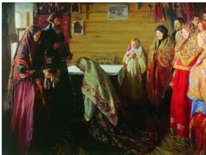
Рисунок 2 – И.С. Куликов «Старинный обряд благословения невесты в городе Муроме», 1909 г.

В этих работах будущие жены явно недовольны выбором кандидата в мужья и, скорее всего, этот выбор был сделан родителями.