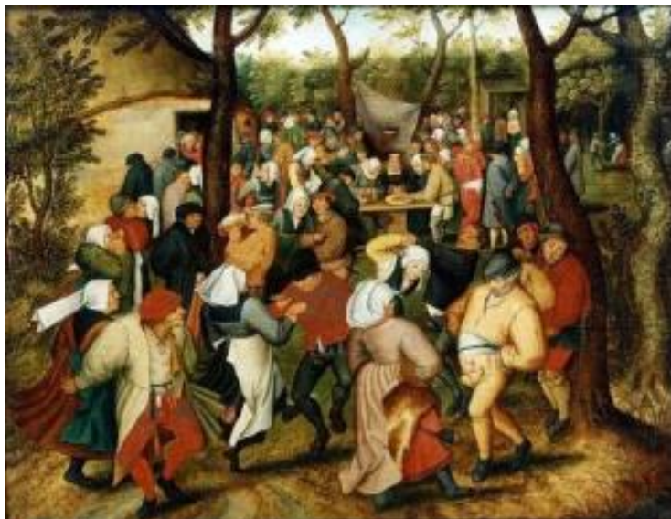
Рисунок 18 – Питер Брейгель старший, «Свадебный танец», 1566 г.

традициям того времени. У деревьев мы видим полотно с брачным венцом. Как уже говорилось ранее, столов в то время не было, и их приходилось сооружать перед торжеством. Так и здесь, на заднем плане мы видим канавы, которые выкопали для того, чтобы они служили столами и сиденьями.