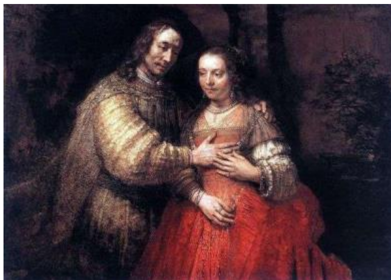
Рисунок 21 – Харменс ван Рейн Рембрандт, «Еврейская невеста», 1665 г.

Однако предположение коллекционера было ошибочным, мужчина едва ли является отцом девушки. Мы видим, что пара изображена в достаточно интимной позе: мужчина обнимает женщину, а она, в свою очередь, прикасается к его руке, тем самым поддерживая этот жест. Интимность их отношений проглядывается в этом прикосновении. Если говорить о композиции, цвете и свете, то этот жест является практически главным элементом работы. Рембрандт был мастером композиции, потому данные приемы использованы здесь умышленно. Окружающую жизнь художник рассматривает как часть Библии, он возводит жесты и позы обыкновенных людей в символические.