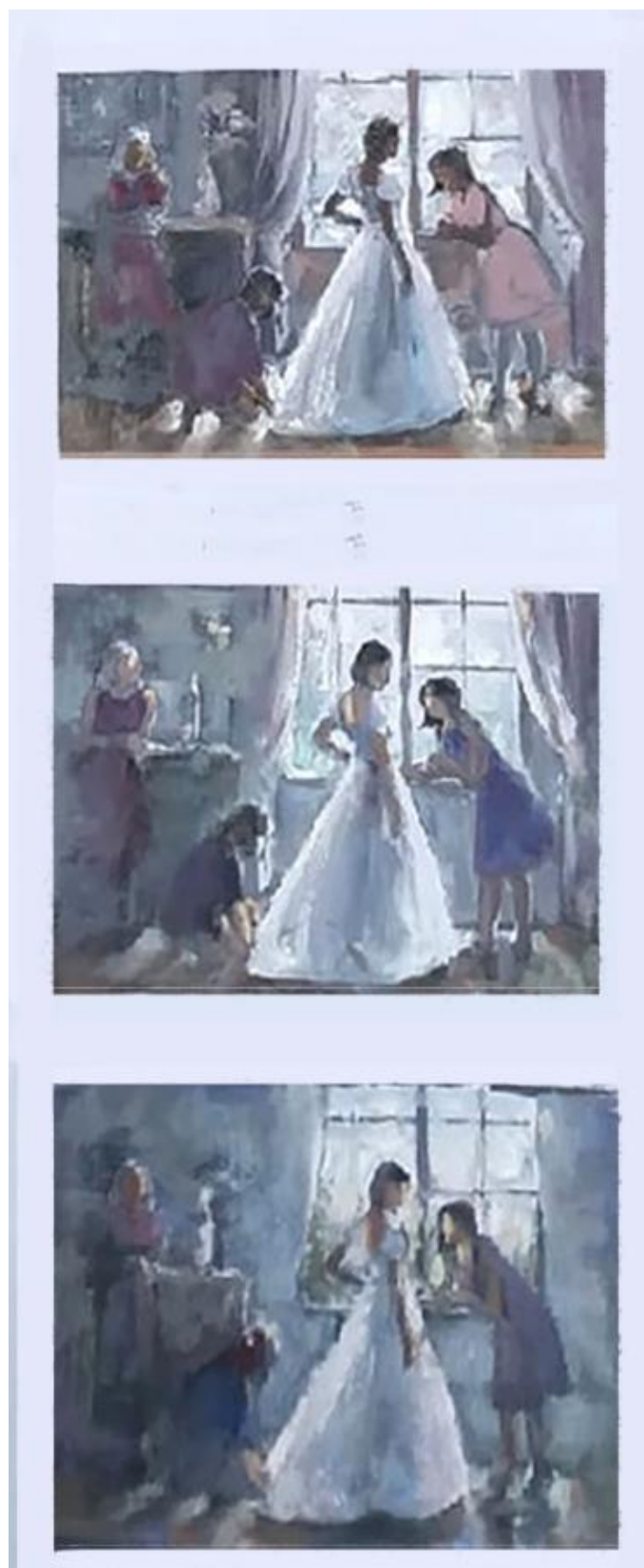
Рисунок Б.1 – Варианты цветовых решений к дипломной работе