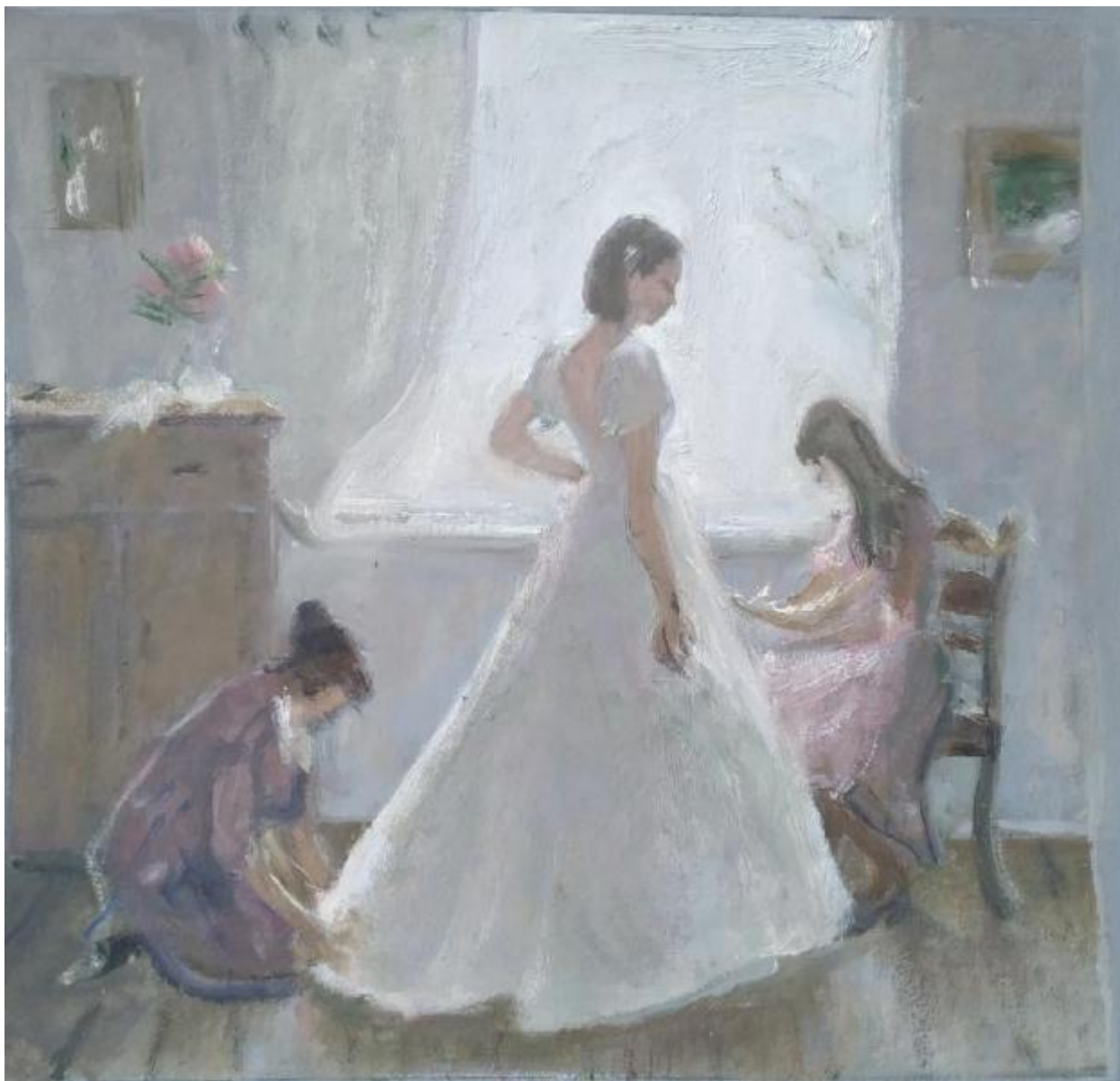
Рисунок Б.6 –Цветовой эскиз к композиции