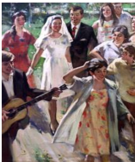
Рисунок 34 – О.Л. Ломакин, «Деревенская свадьба», 1960-е гг.

На картине О. Ломакина «Деревенская свадьба» мы также наблюдаем за счастливой парой, как видно, вот-вот вступившей в брак (Рисунок 34). Молодожены безмерно рады этому событию, вместе с ними радуются и их друзья, и родственники. Гости поют, танцуют и поздравляют молодых. В этой картине также большую роль играет освещение. Художник выделяет главных героев светом, что создает хорошее впечатление. Невеста будто светится от счастья. Зрителю остается только надеяться, что молодоженов ждет долгая и счастливая совместная жизнь.