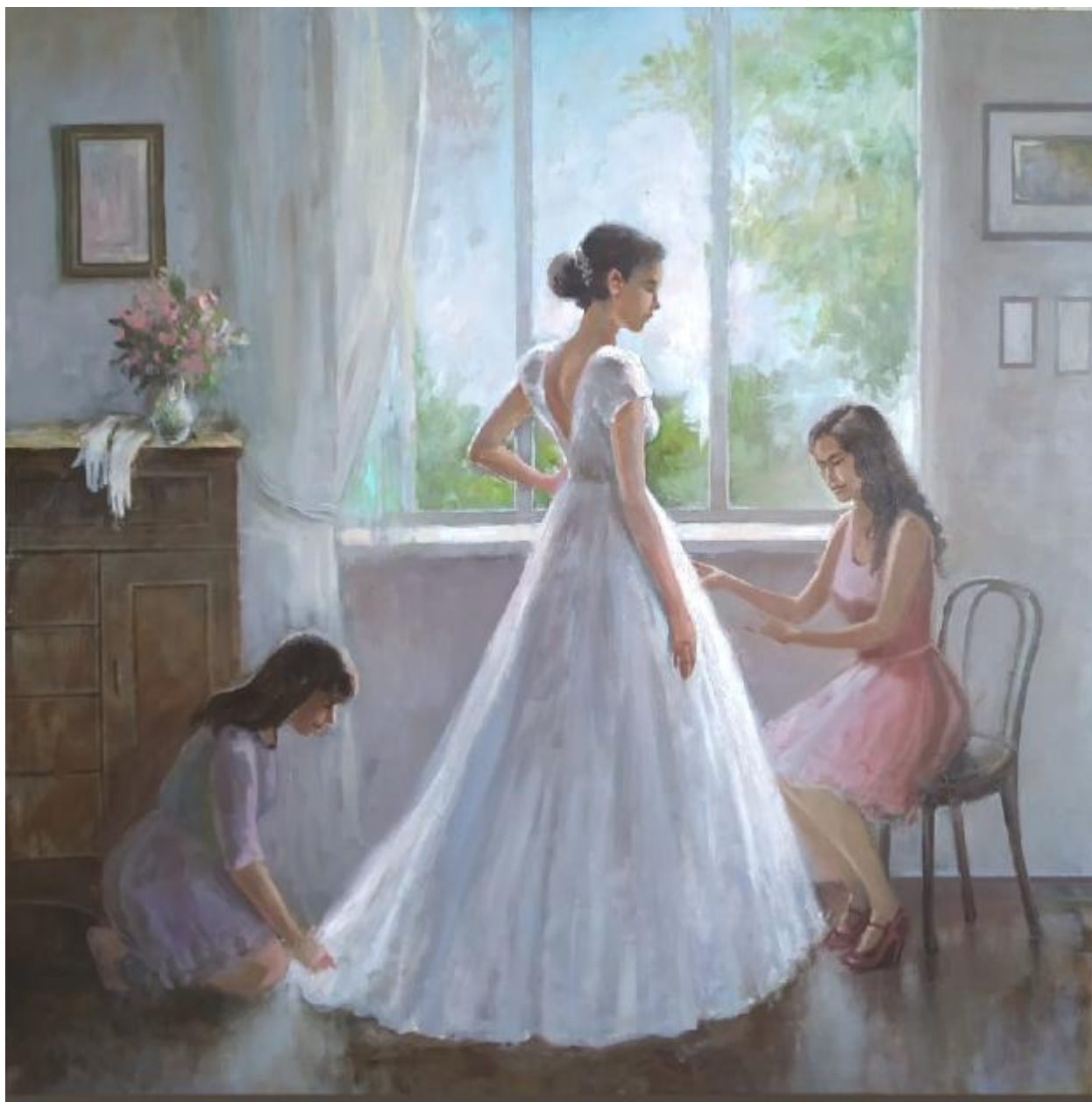
Рисунок Л.1 –«В преддверии торжества», 82x82 см, холст, масло