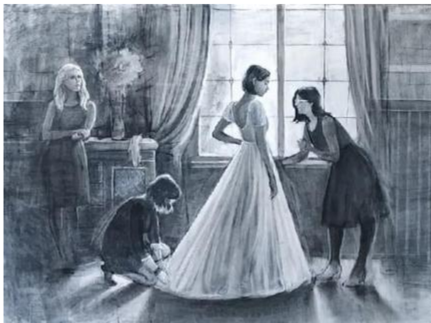
Рисунок И.1 – Первоначальный вариант картона к картине «В преддверии торжества»