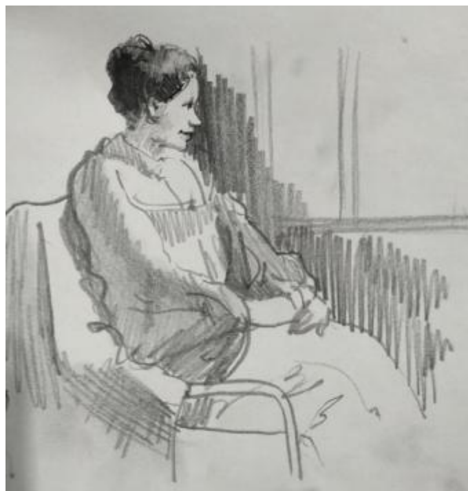
Рисунок Г.2– Набросок сидящей женской фигуры в профиль