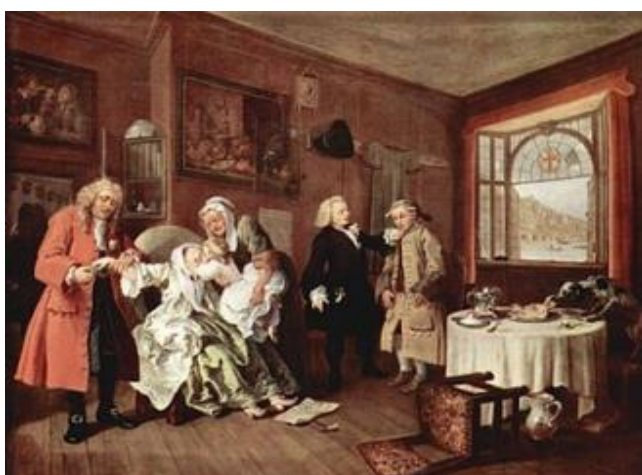
Рисунок 27 – Уильям Хогарт, «Смерть графини», 1745 г.

Смерть графини. В последнем эпизоде умирает графиня (Рисунок 27). Она принимает яд, узнав о том, что ее возлюбленный казнен. К погибшей поднесли дочь для прощания. Из-за отвратительного образа жизни отца ребенок болен. Художник дает зрителю понять, что их дочь вряд ли доживет до старости. Даже пол ребенка говорит о том, что у рода не будет продолжения. Картины на стенах на этот раз описывают жизнь низших классов.