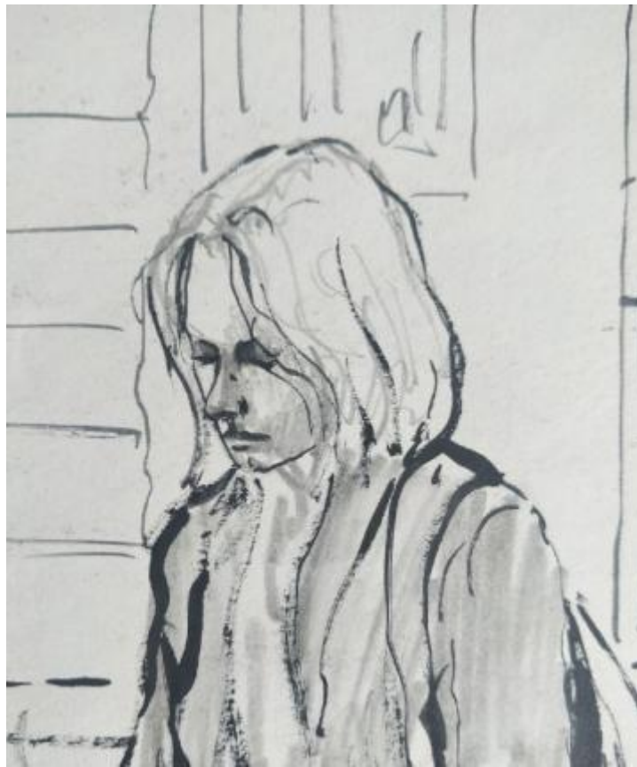
Рисунок В.3 – Поисковый набросок героини картины «В преддверии торжества»