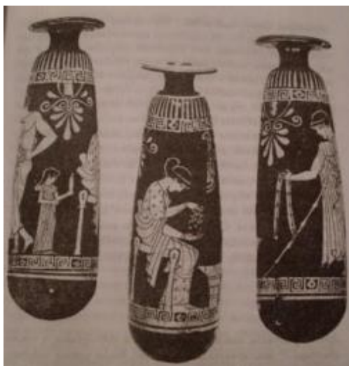
Рисунок 9 – Автор неизвестен, Алабастр, 470 г. до н.э.

прекрасна). Девушка получает в подарок пояс, который играет важную роль в свадебном ритуале.