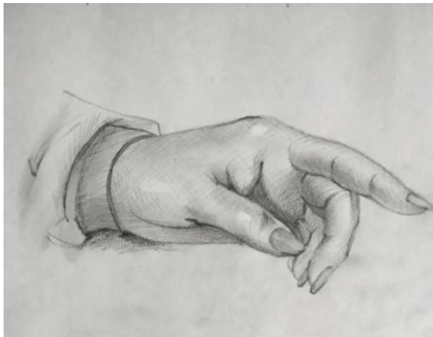
Рисунок В.4 – Набросок руки