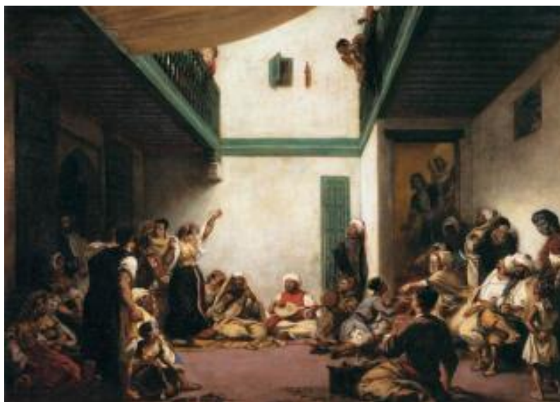
Рисунок 20 – Эжен Делакруа, «Еврейская свадьба в Марокко», 1841 г.

К теме свадьбы в своем творчестве обращался и такой замечательный художник, как Рембрандт Харменс ван Рейн. Это величайший голландский художник живописец, офортист и рисовальщик. Рембрандтом были созданы замечательные произведения практически во всех жанрах, мастер использовал различные техники письма: живопись, рисунок и офорт. Рембрандт оказал огромное влияние на многих художников. Художник остался известен и после своей смерти, его работами восхищаются и по сей день. Он получил истинное признание, став одним из выдающихся живописцев всех времён. Рассмотрим картину Рембрандта, посвященную теме свадьбы. Эта картина – портрет, в котором персонажи имеют определенные роли, а именно – они изображают пару Исаака и Ревекку, которые поселились в земле Филистимской и выдавали себя за кровных родственников из страха [33].