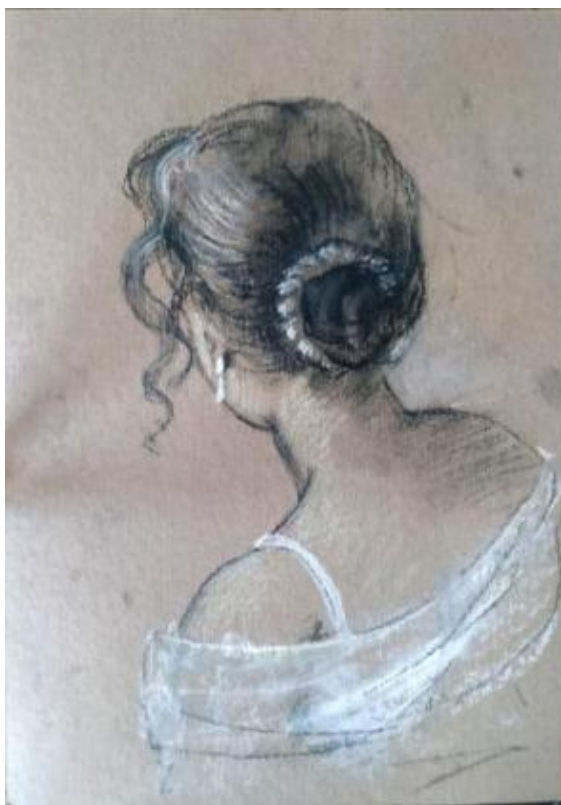
Рисунок Е.1 – Эскиз свадебной прически