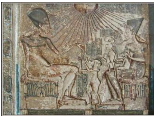
Рисунок 8 – Автор неизвестен, «Эхнатон и его семья»

Из всего вышесказанного следует сделать вывод, что для египтян первых тысячелетий семья – это основа. Даже боги состояли в браке. Жители Древнего Египта гордились крепкими семейными узами, ценили хорошие отношения и, конечно, стремились их создать. Дом в их понимании был источником счастья, уюта, комфорта и радости.