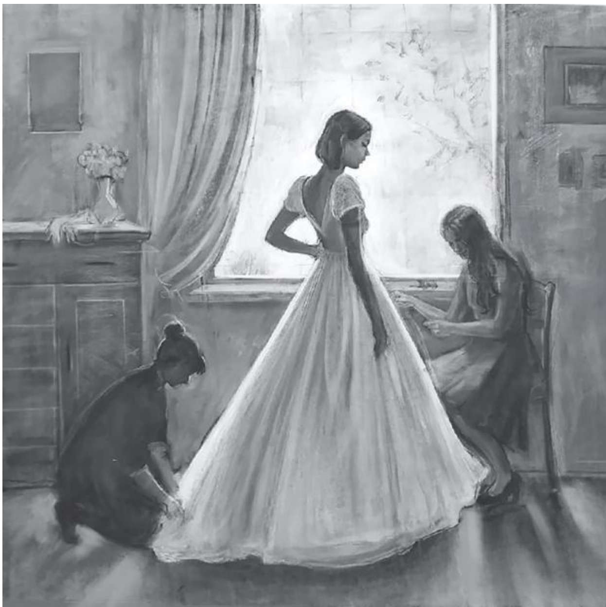
Рисунок К.1 – Картон к картине «В преддверии торжества»