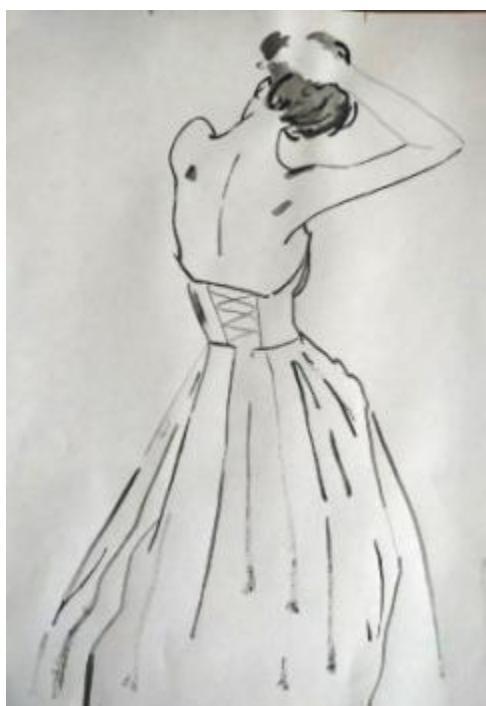
Рисунок В.2 – Набросок женской фигуры в свадебном платье