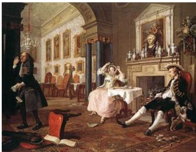
Рисунок 23 – Уильям Хогарт, «Вскоре после свадьбы», 1743 г.

Визит к шарлатану. В третьем эпизоде мы видим комнату доктора-шарлатана (Рисунок 24). Молодой человек посетил врача вместе с новой возлюбленной на стороне. Если приглядеться, то можно увидеть черное пятнышко на шее мужчины. Это говорит о том, что он болен. Доктор дает совет воспользоваться ртутными пилюлями, которыми лечили в то время, но, как видно, лекарство оказалось бессильным, и присутствующие с угрозами требуют иного лечения.