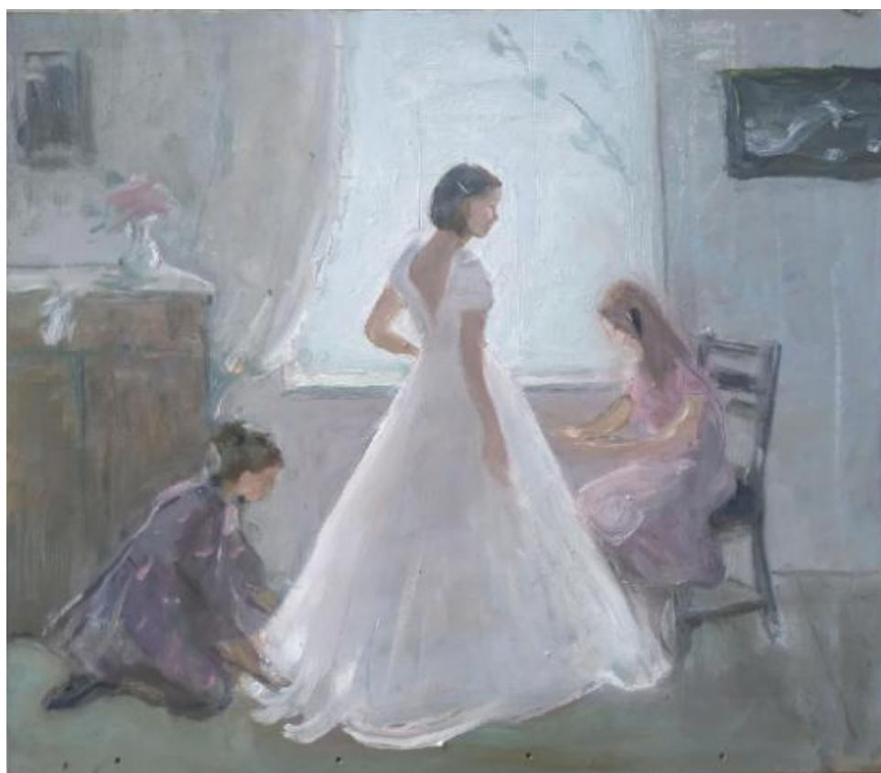
Рисунок Б.5 – Цветовой эскиз к композиции