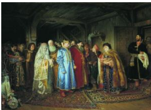
Рисунок 1 – К.В. Лебедев «Боярская свадьба», 1883 г.

Художники разных эпох обращались к теме свадьбы, ведь с этим обычаем связано многое. Социальное значение его сводится к созданию новой семьи, установлению родства, изменению семейно-возрастного положения и публичному признанию статуса людей, вступающих в брак. Обращаясь к картинам Великих мастеров, мы можем заметить, что деятели искусства изображают свадьбу по-разному: кто-то – как нечто прекрасное, подчеркивая ценность и значимость торжества. А кто-то, наоборот, показывает, как свадьба рушит чье-то счастье и надежды на светлую и счастливую жизнь. Спустимся «в глубь веков» – обратимся к картине К. Лебедева «Боярская свадьба» (Рисунок 1). Эта работа, как видно, написана с юмором – жених имеет сходство Митрофанушкой, а отец, похож на карикатурного купца. Мы видим, что невеста здесь несчастна – закутанная, с опущенной головой, она стоит позади. Ее отец находится рядом с ней, по его взгляду можно понять, что он тоже недоволен.