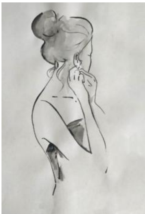
Рисунок В.1 –Набросок женской фигуры