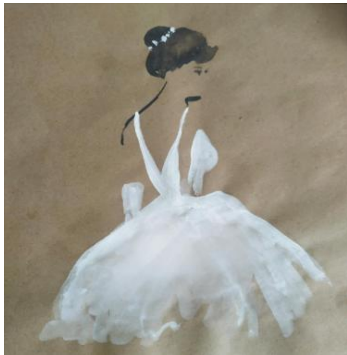
Рисунок Е.6 – Эскиз фигуры невесты в платье