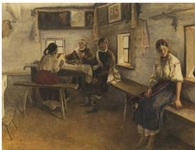
Рисунок 3 – Н.К. Пимоненко, «Засватали», 1896 г.