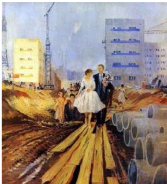
Рисунок 4 – Ю. И. Пименов, «Свадьба на завтрашней улице», 1962 г.

Обратимся к картине Ю. Пименова «Свадьба на завтрашней улице» (Рисунок 4). На ней изображены новобрачные, радостно идущие к своему светлому будущему, счастливые и свято верующие в завтрашний день.