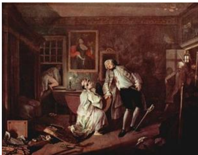
Рисунок 26 – Уильям Хогарт, «Дуэль и смерть графа», 1745 г.

Смерть графини. В последнем эпизоде умирает графиня (Рисунок 27). Она принимает яд, узнав о том, что ее возлюбленный казнен. К погибшей поднесли дочь для прощания. Из-за отвратительного образа жизни отца ребенок болен. Художник дает зрителю понять, что их дочь вряд ли доживет до старости. Даже пол ребенка говорит о том, что у рода не будет продолжения. Картины на стенах на этот раз описывают жизнь низших классов.