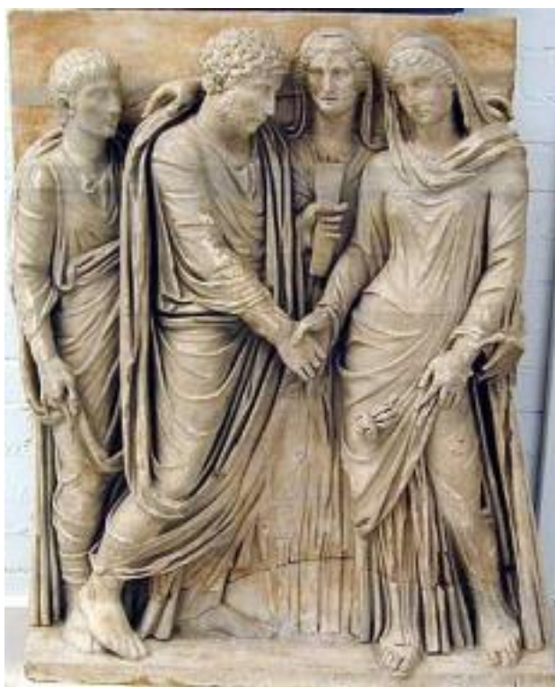
Рисунок 14 – Автор неизвестен, на рельефе изображена Свадебная церемония

Нельзя не упомянуть и скульптуру, которая пользовалась огромной популярностью у римлян. Рассмотрим рельеф из проконнесского мрамора с фасада саркофага: римская свадебная церемония (Рисунок 14). Между будущими супругами ранее была фигура бога Гименея, который нес факел для свадебной процессии. Рельеф был восстановлен в восемнадцатом веке, предположительно, скульптором Кавачеппи.