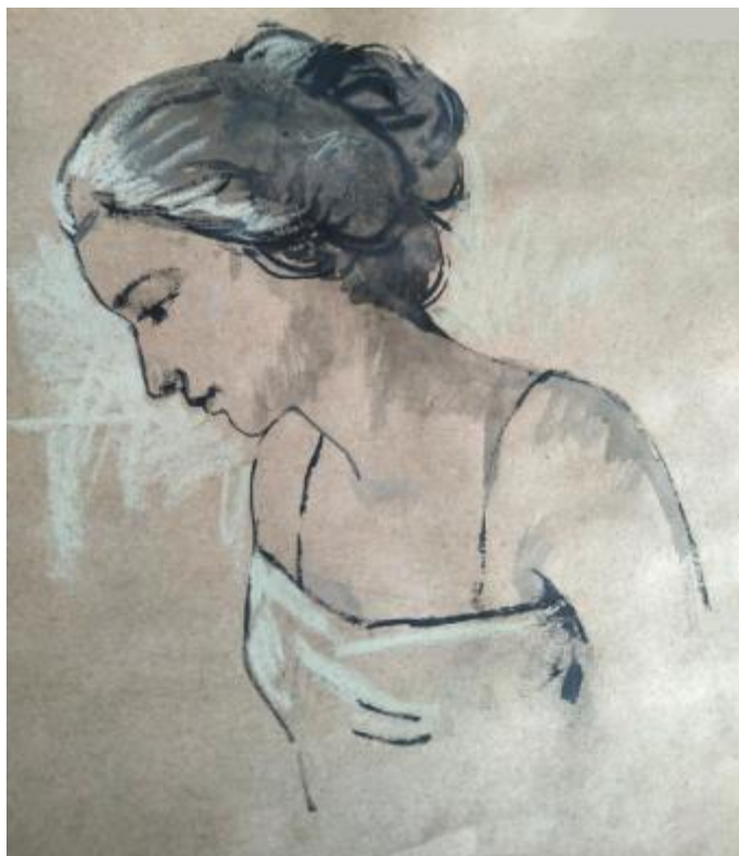
Рисунок Е.3 – Эскиз невесты