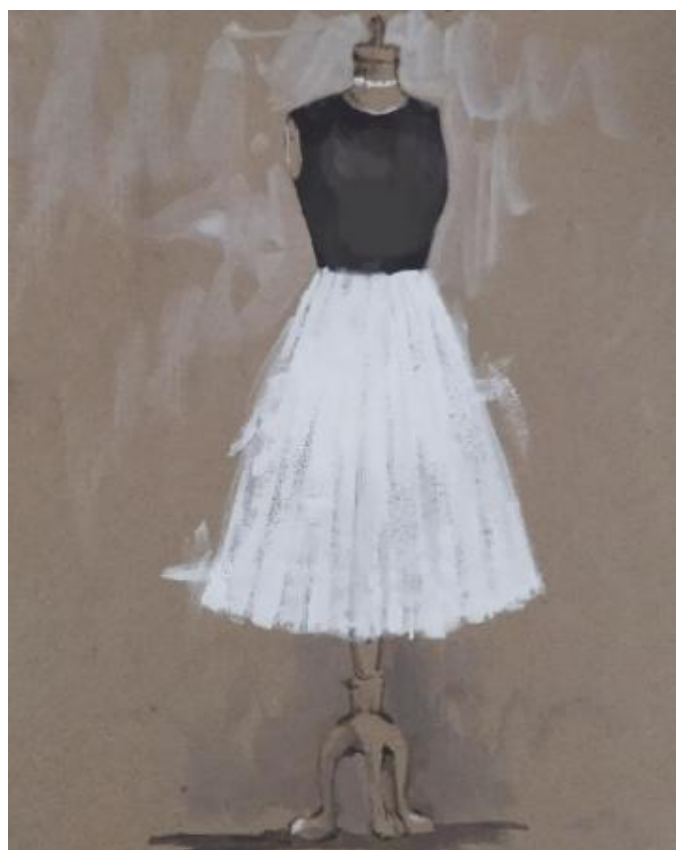
Рисунок В.6 – Эскиз платья