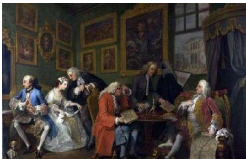
Рисунок 22 – Уильям Хогарт, «Брачный контракт», 1743 г.

Вскоре после свадьбы. Второй эпизод этой серии описывает утро молодых (Рисунок 23). Понятно, что молодожены не заинтересованы друг в друге, им все равно. По наряду мужа становится ясно, что ночь он провел за пределами дома, а жена, видимо, только недавно проснулась. Слева мы видим уходящего управляющего имением. Он держит пачку счетов, которые, по всей видимости, еще не оплачены. Из кармана, расстроенного новостью о счетах хозяина торчит дамский чепчик, на который обратила внимание собака. И снова мы видим символ несчастной жизни новобрачных—на стене висит картина, на которой изображен Амур посреди развалин. Видимо, здесь говорится о бедном положении мужчины, становится ясно, что в конечном итоге он останется ни с чем.