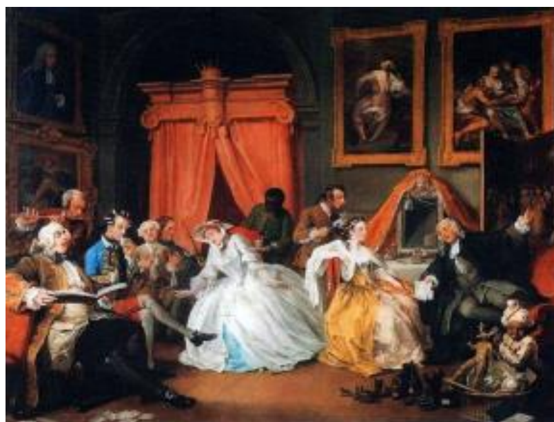
Рисунок 25 – Уильям Хогарт, «Будуар графини», 1745 г.

Будуар графини. Четвертый эпизод показывает принимающую гостей даму (Рисунок 25). Действие происходит во время утреннего туалета. В этом эпизоде мы можем наблюдать, как девушка флиртует с адвокатом, а ее подруга не сводит глаз с певца. Хогарт подчеркивает, что на его картине изображены именно люди с определенными характерами и типажам, которые он видел в современном ему обществе.