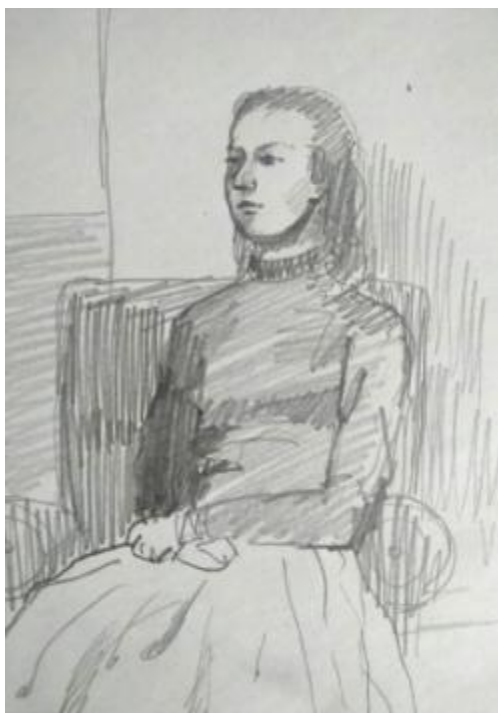
Рисунок В.5 –Набросок сидящей женской фигуры