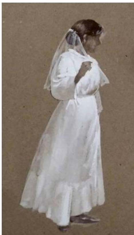
Рисунок Е.8 – Эскиз фигуры невесты в платье в полный рост