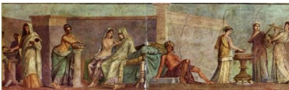
Рисунок 11 – «Свадьба Альдобрандини», 20-10 года до н. э.

Эта работа олицетворяет переход из старой, привычной жизни в новую, еще неизведанную и явно пугающую невесту. Однако сидящая рядом с ней женщина успокаивает ее, вселяя уверенность и настраивая на счастье с мужем.