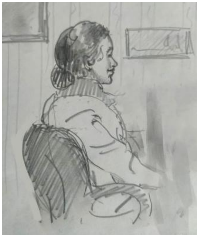
Рисунок Г.1– Набросок женской фигуры в профиль