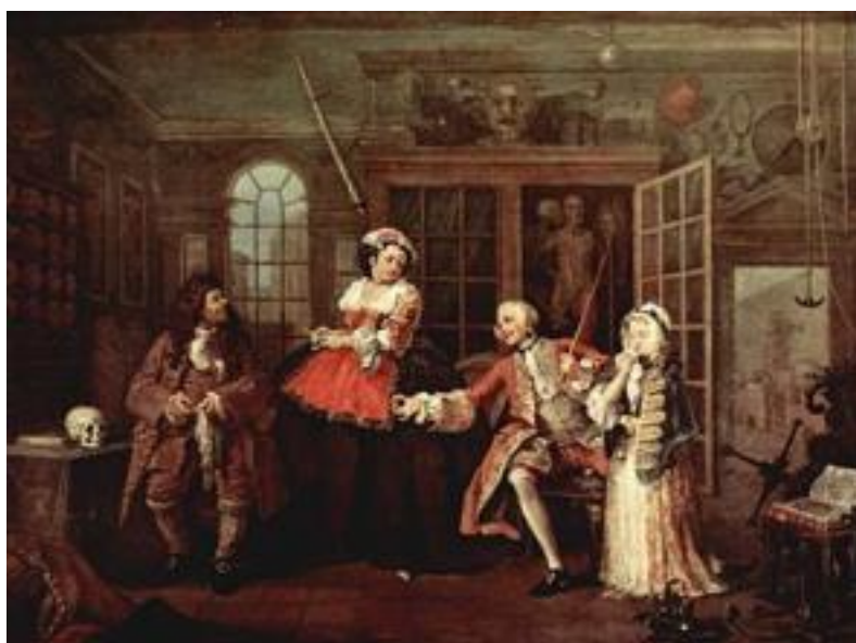
Рисунок 24 – Уильям Хогарт, «Визит к шарлатану», 1745 г.

Визит к шарлатану. В третьем эпизоде мы видим комнату доктора-шарлатана (Рисунок 24). Молодой человек посетил врача вместе с новой возлюбленной на стороне. Если приглядеться, то можно увидеть черное пятнышко на шее мужчины. Это говорит о том, что он болен. Доктор дает совет воспользоваться ртутными пилюлями, которыми лечили в то время, но, как видно, лекарство оказалось бессильным, и присутствующие с угрозами требуют иного лечения.