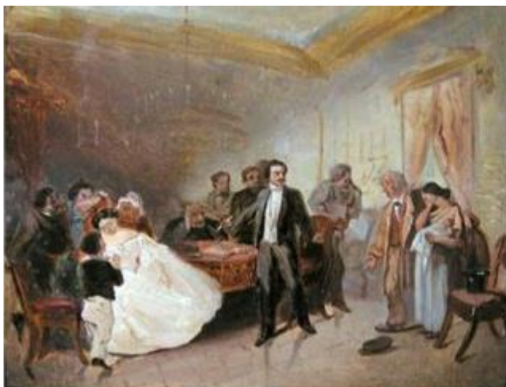
Рисунок 29 – А. М. Волков, «Прерванное венчание», 1860 г.

Если взглянуть на эскиз к этой картине, то становится ясно, что изначально сюжет ее был куда более печален (Рисунок 29). Художник хотел дать иное название полотну – «Прерванное венчание». Богатая невеста здесь не в розовато-красном, а в белом платье, что говорит о том, что на момент прихода покинутой девушки была уже свадьба.