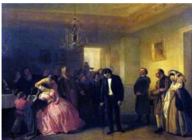
Рисунок 28 – А. М. Волков, «Прерванное обручение», 1860 г.