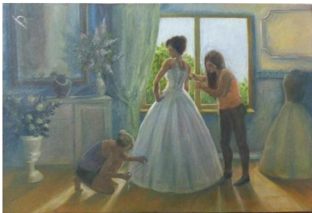
Рисунок А.2 – Цветовое решение к композиции «Свадебные хлопоты»