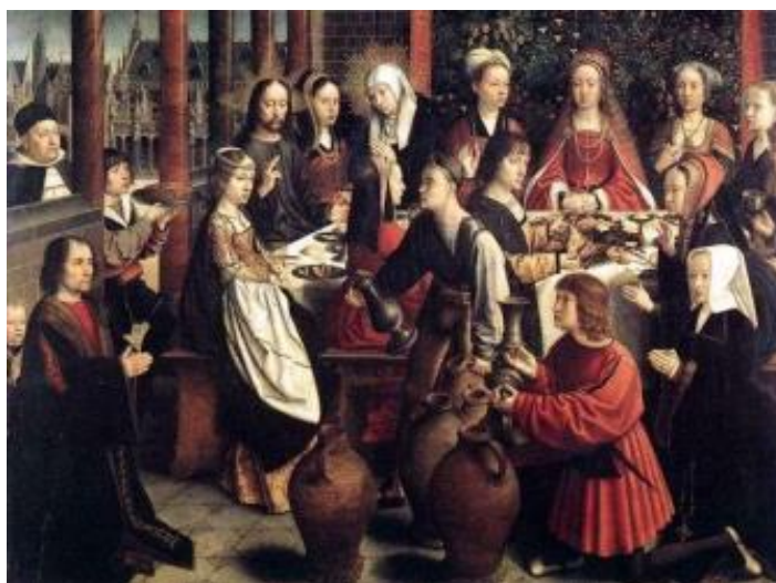
Рисунок 15 – Герард Давид, «Браке в Кане», Около 1500-1510

Самые значимые работы выполнены художником в период с 1498 по 1509 год. К ним относится и «Браке в Кане». Художник рассказывает о пире в честь свадьбы в присутствии Христа и Девы Марии. Благодаря тщательно выписанным предметам мы можем наблюдать будничную красоту того времени. Фигуры и место действия прекрасно написаны. Картину приобрел для Лувра в 1683 году король Людовик XIV. Она и по сей день хранится там.