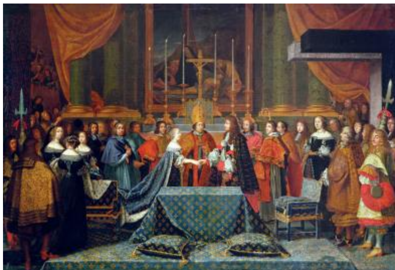
Рисунок 19 – «Свадьба Людовика XIV и Марии Терезии», 1660 г.

Рассмотрим еще одну свадьбу, написанную Эженом Делакруа (Рисунок 20). Когда художник был в Марокко, то побывал на еврейской свадьбе. Эжен записал все, чтобы не упустить ни одной малейшей детали при написании полотна. Свадьба у евреев состояла из двух действий: дневного и вечернего. Днем у дома собираются гости и присутствуют там до самого позднего вечера. После люди заходят в дом, и праздник продолжается уже внутри. На картине мы видим гостей, собравшихся у дома. Кто-то из людей сидит, кто-то стоит, кто-то играет на музыкальных инструментах. Слева мы видим танцующую красиво одетую девушку. У двери располагаются молодожены, а юноша с подносом собирает для них деньги. Это, скорее всего, еврейский обычай. С балконов за происходящим с любопытством наблюдают зрители. Гости одеты празднично, благодаря прекрасно подобранной цветовой гамме создается впечатление, что людям действительно весело. Свадьба проходит успешно.