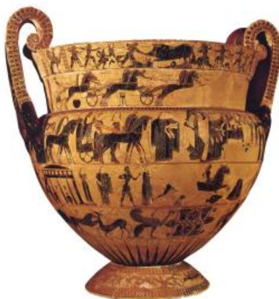
Рисунок 10 – «Кратер Клития» (древнегреческий кратер, расписанный в стиле аттической чернофигурной вазописи), 570 г. до н. э.

Итак, для Древней Греции тема семьи была очень важна, а брак и сама процессия очень часто изображались художниками.