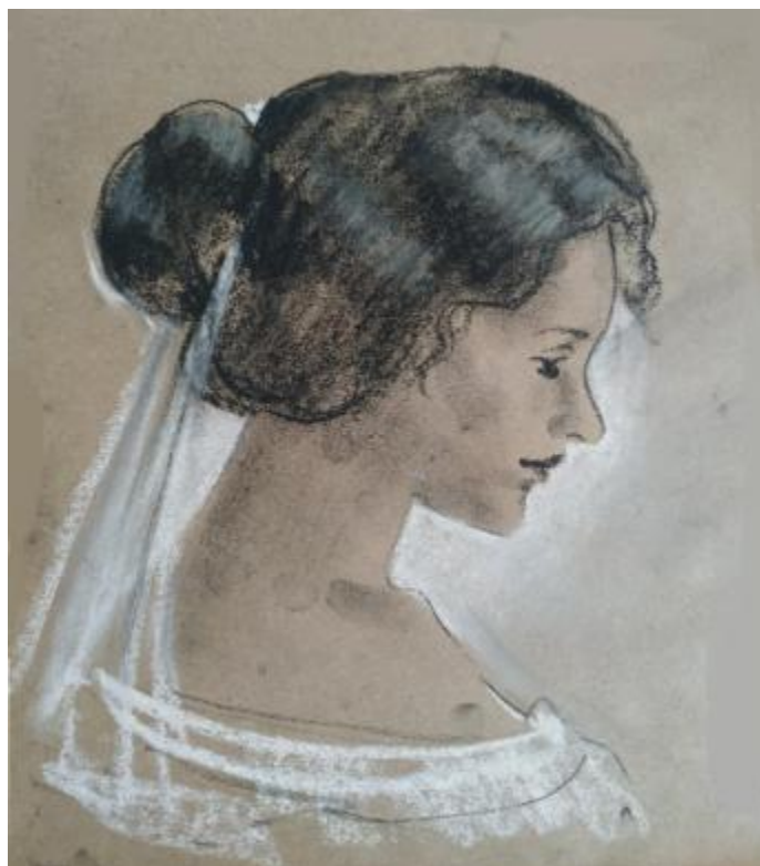
Рисунок Е.4 – Эскиз невесты