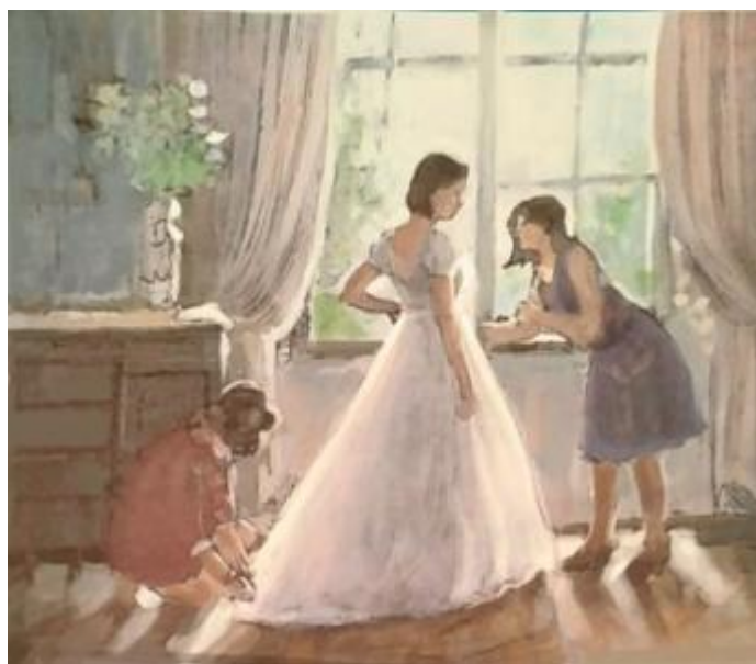
Рисунок Б.3 –Вариант цветового эскиза