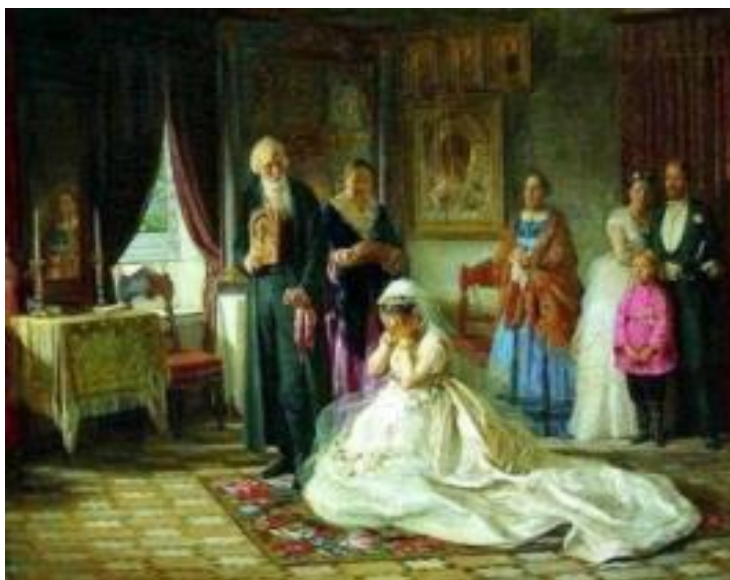
Рисунок 30 – Ф. С. Журавлев, «Перед венцом», 1874 г.

Публика яростно обсуждала картину, критики хвалили её. Автор даже сделал несколько копий. Позже картины мастера были признаны лучшими в изображении быта и нравов 1860-1870-х гг.