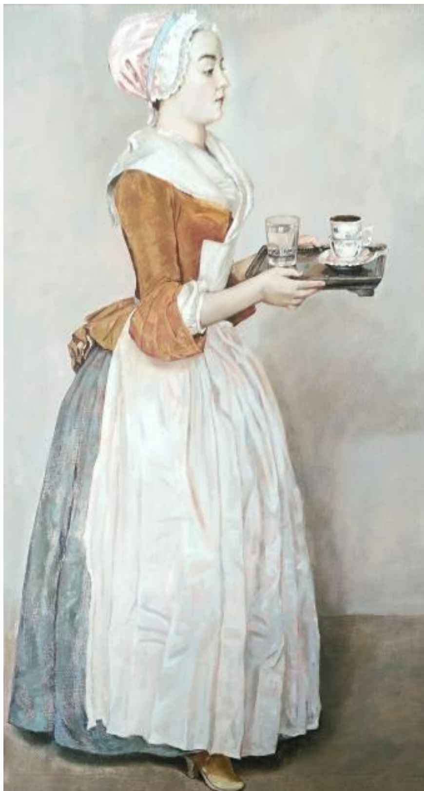
Рисунок Ж.1 –Копия картины «Шоколадница» Жана-Этьена Лиотара