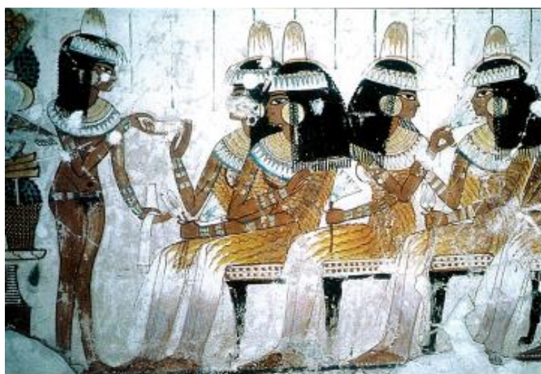
Рисунок 6 – Автор неизвестен, «Гости на свадебном банкете», роспись из гробницы Нахта в Долине Царей», около 1350 г. до н.э.

Рассмотрим роспись из гробницы Нахта в Долине Царей (Рисунок 6). На этой работе мы видим изображение свадьбы, а именно – самого празднества. Люди на росписи выглядят счастливыми и довольными, что говорит о том, что брак удачный.