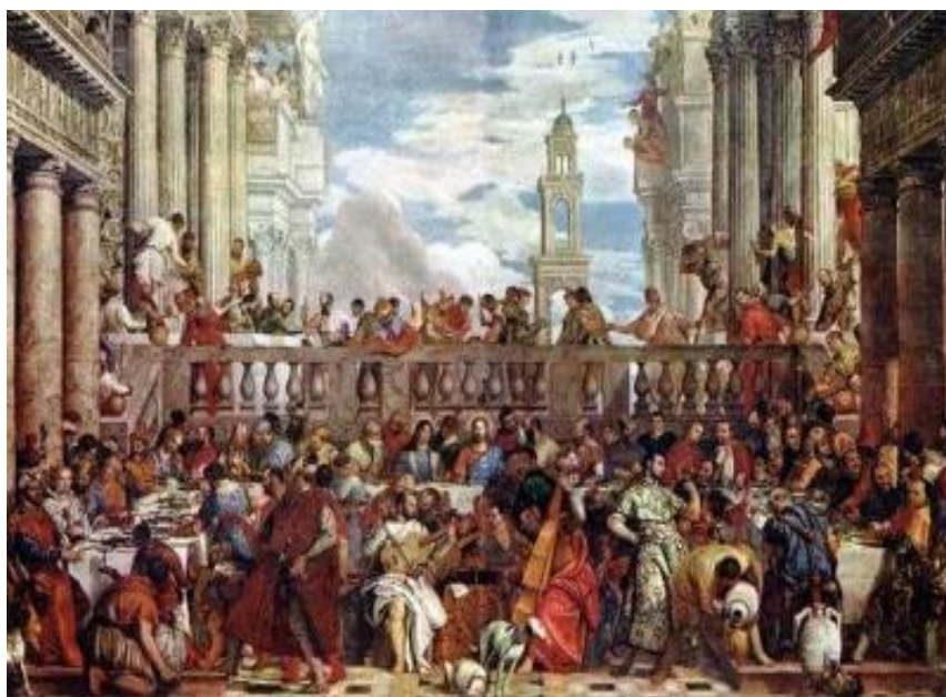
Рисунок 16 – Паоло Веронезе, «Брак в Кане Галилейской», 1562-1563 гг.

На данный момент работа находится в Лувре. Эта картина изначально являлась заказом монахов для католического монастыря. Живописная работа провисела в центральном соборе Венеции до завоевания Италии Наполеоном, после же французская армия вывезла его из страны [31].