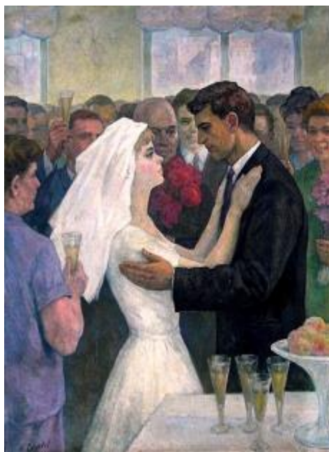
Рисунок 33 – М. Ю. Садунов, «Свадьба», 1965 г.

На картине О. Ломакина «Деревенская свадьба» мы также наблюдаем за счастливой парой, как видно, вот-вот вступившей в брак (Рисунок 34). Молодожены безмерно рады этому событию, вместе с ними радуются и их друзья, и родственники. Гости поют, танцуют и поздравляют молодых. В этой картине также большую роль играет освещение. Художник выделяет главных героев светом, что создает хорошее впечатление. Невеста будто светится от счастья. Зрителю остается только надеяться, что молодоженов ждет долгая и счастливая совместная жизнь.