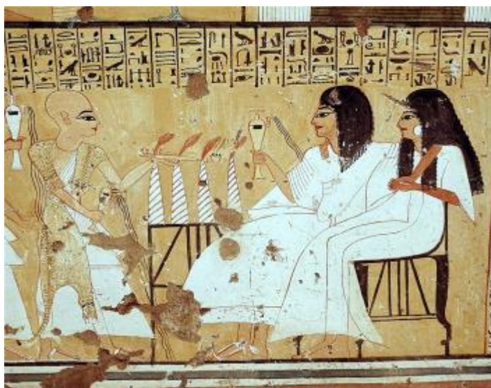
Рисунок 7 – Автор неизвестен, «Вельможа Инхеркау с женой. Гробница Инхеркау», 1140 г. до н.э.

В период четвертой династии появились одни из первых рельефов, которые изображают семью, ее ценность в обществе. Лирические жанры сменили тяжеловесную статичность. Рассмотрим один из рельефов на тему женитьбы. Например, «Вельможа Инхеркау с женой. Гробница Инхеркау» (Рисунок 7). На рельефе мы видим изображенных в профиль гостей, принимающих различные угощения в честь праздника. Очевидно, гости веселятся, поздравляют брачующихся и радуются появлению семьи – новой ячейки общества. Семья была очень важна для египтян, зачастую рельефы делались и с уже замужних пар, дабы показать их значение в обществе.