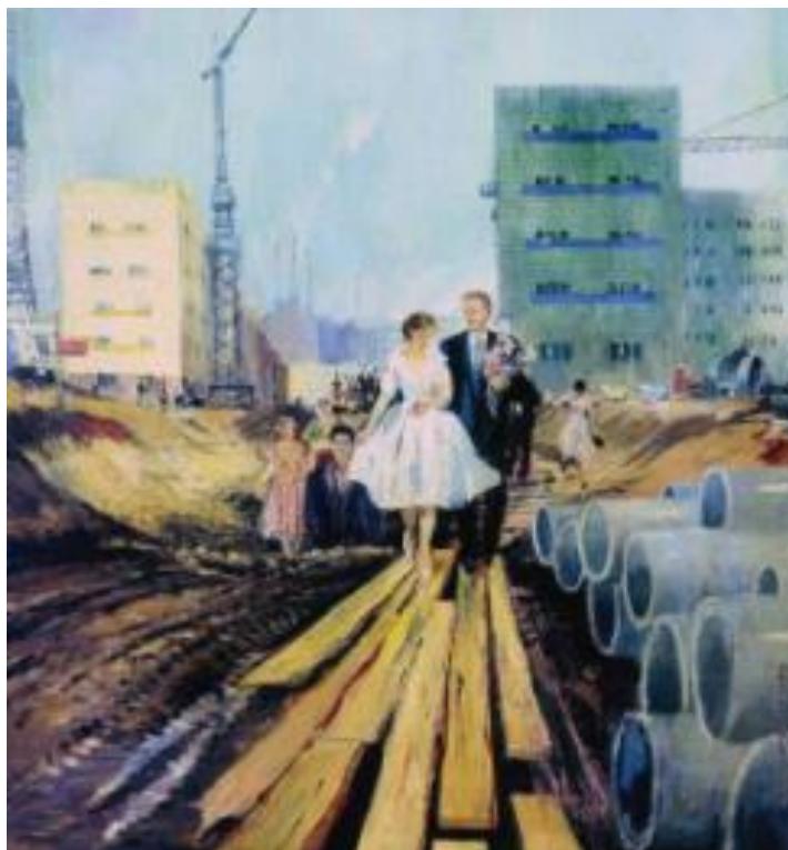
Рисунок 31 – Ю. И. Пименов, «Свадьба на завтрашней улице», 1962 г.

праздника. Эта работа вызывает ностальгию у людей шестидесятых годов, ведь на ней практически каждый может разглядеть в идущих в светлое будущее молодоженах себя.