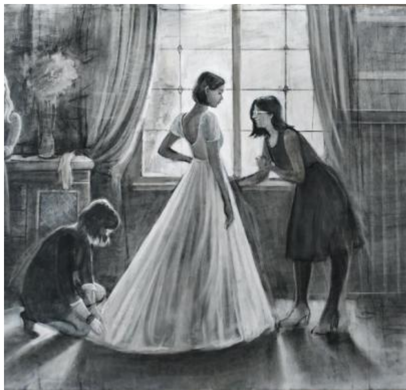
Рисунок И.2 – Изменение формата картона к картине «В преддверии торжества»