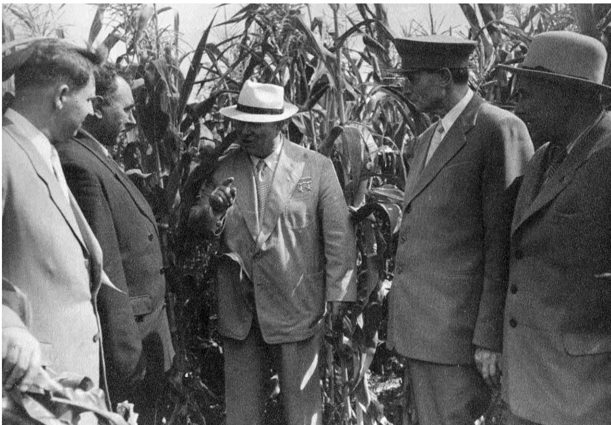
Рисунок В.1 – Фотография приезда Н.С. Хрущева в колхоз «Путь Ленина» в сентябре 1958 г.