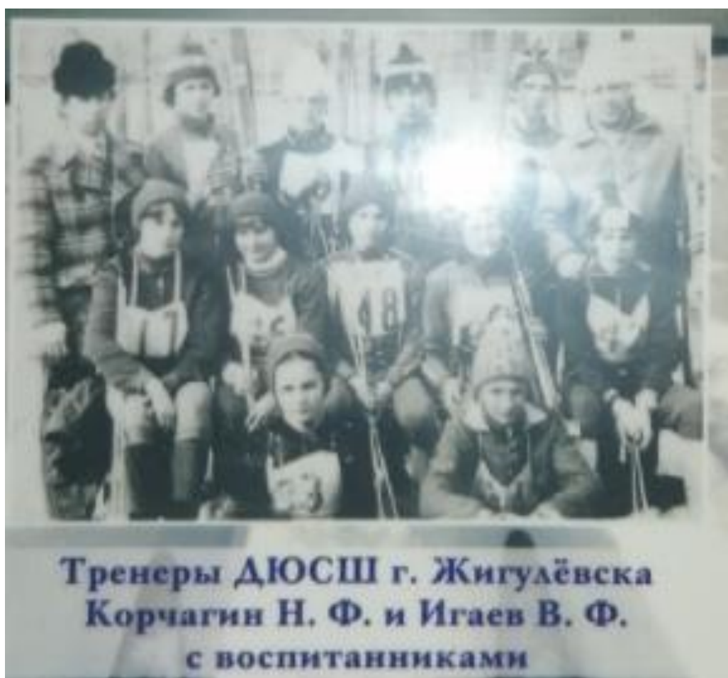
Рисунок А.5 – Тренеры ДЮСШ г. Жигулевска с воспитанниками