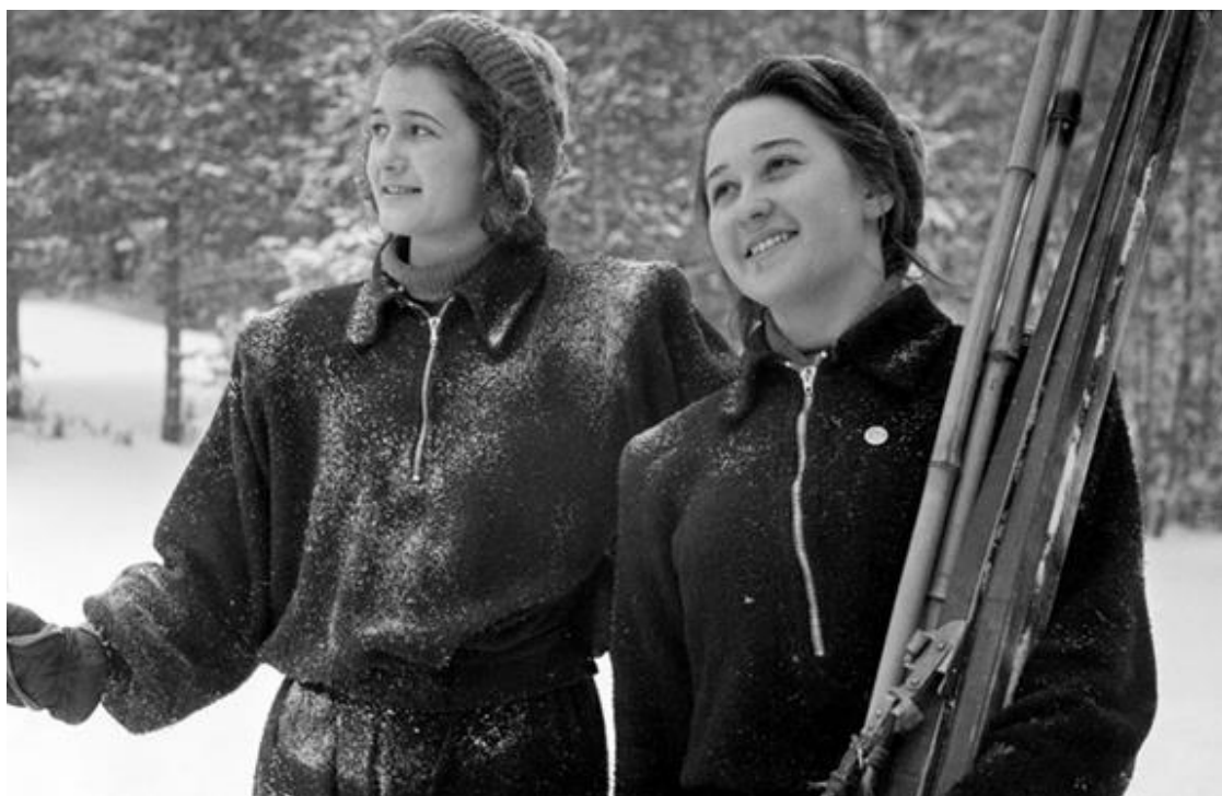
Рисунок А.1 – Лыжницы г. Жигулевска