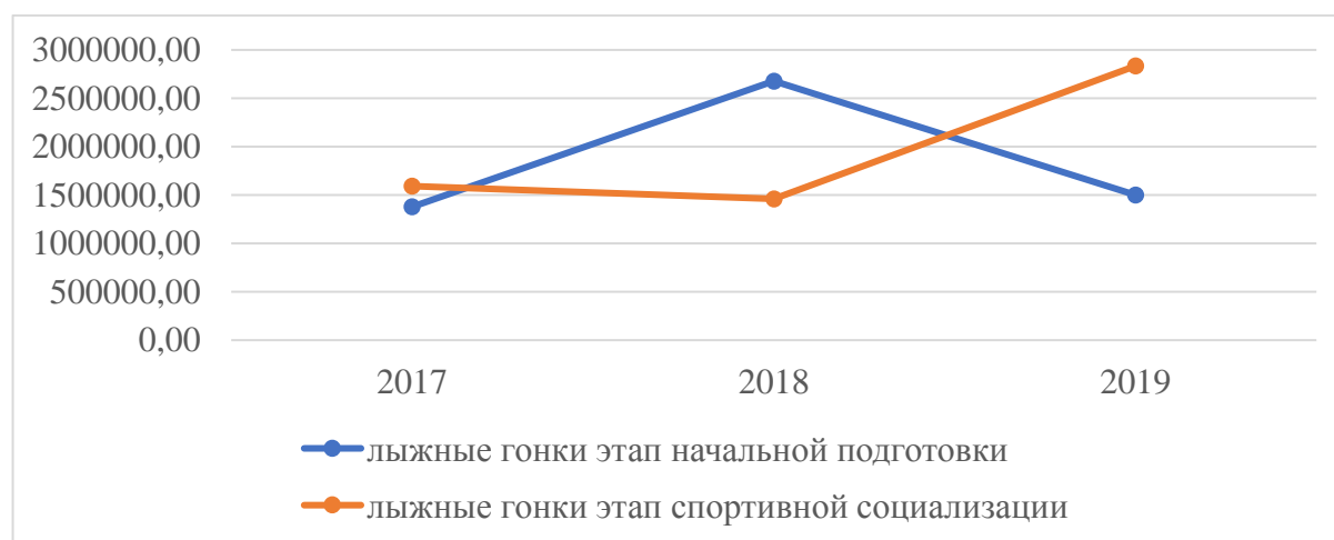
Рисунок 2 – Анализ финансирования лыжного спорта в ГАУ СО «СШОР № 3 им. О.А. Сайтова» за 2017-2019 г.г. по направлениям подготовки

Представим анализ финансирования спортивного направления в школе за 2017-2019 гг. на рисунке 2 по направлениям занимающихся.