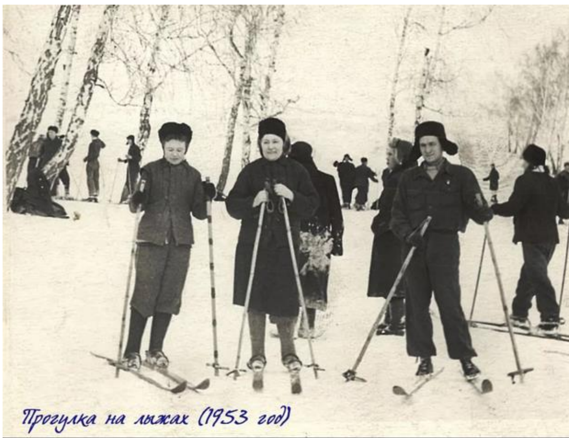
Рисунок А.3 – Прогулка на лыжах. г. Жигулевск, 1953 г.