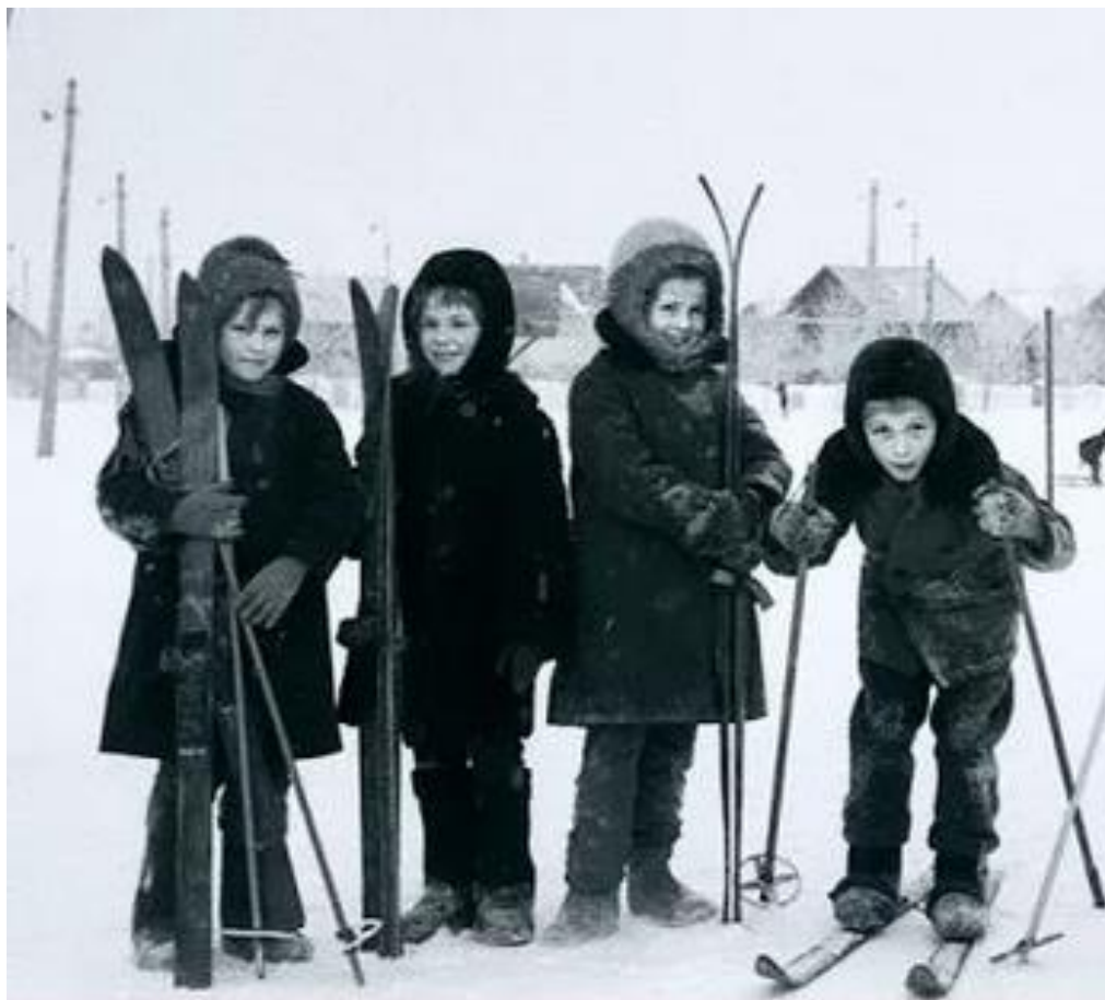
Рисунок А.2 – Дети-лыжники г. Жигулевска