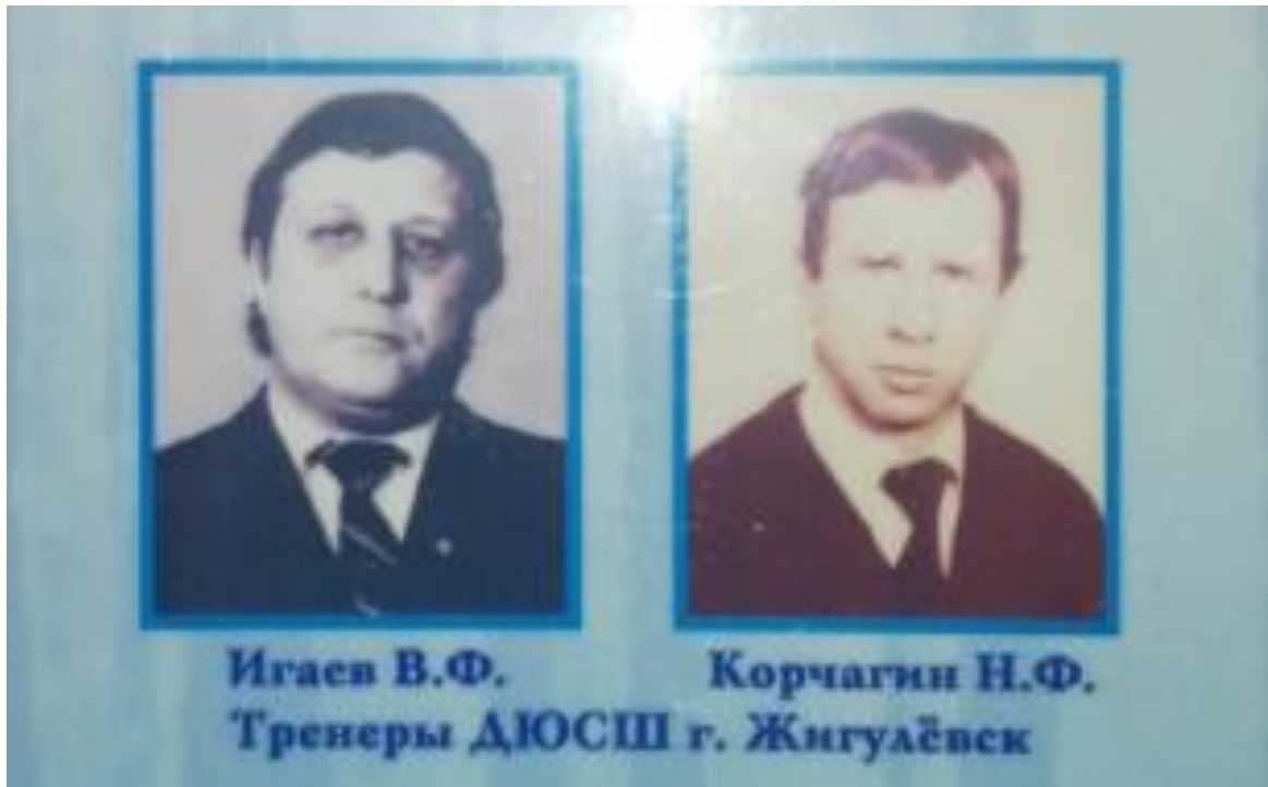
Рисунок А.6 – Тренеры ДЮСШ г. Жигулевска