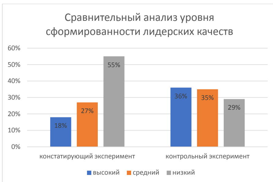
Рисунок 3 – Сравнительный анализ уровня сформированности лидерских качеств подростков

При сравнении результатов констатирующего и контрольного этапов эксперимента, мы замечаем положительную динамику. На этапе контрольного эксперимента 20 человек (36 %) продемонстрировали высокий уровень сформированности лидерских качеств, что на 18 % больше, чем было на этапе констатирующего эксперимента. После реализации программы внеурочной деятельности «Лидер РДШ – лидер навсегда!», из 55 активистов 16 человек (29 %) показали низкий уровень сформированности лидерских качеств, что на 26 % меньше по сравнению с первоначальным показателем. Что наглядно видно на диаграмме, представленной на рисунке 3.