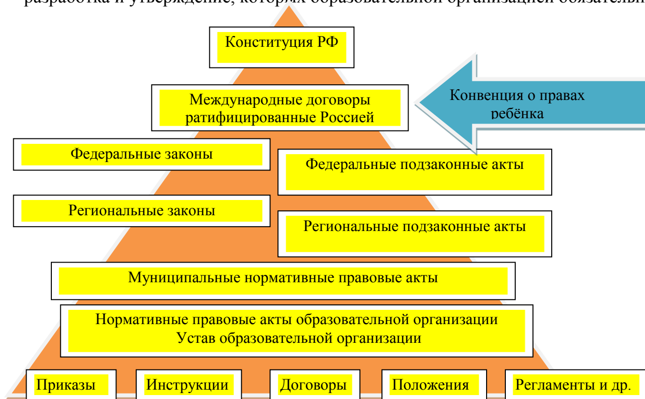
Рисунок 1 - Иерархическая система образовательного законодательства

актов. А также устанавливает перечень локальных нормативных актов разработка и утверждение, которых образовательной организацией обязательна.