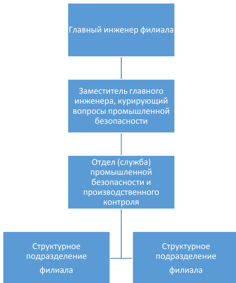
Рисунок 1.1 - Структурная схема производственного контроля

Структурная схема производственного контроля приведена на рисунке 1.1.