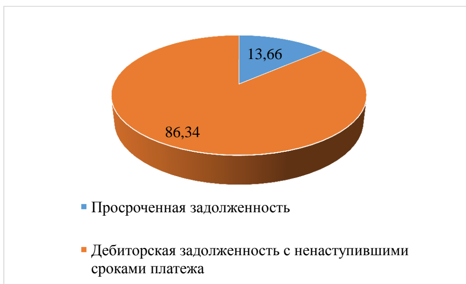
Рисунок 4 - Структура дебиторской задолженности ООО «Авенир»

1.2. Усовершенствовать кредитную политику организации. При внедрении рекомендаций по совершенствованию кредитной политики предполагается сокращение просроченной дебиторской задолженности. Структура задолженности представлена на рисунке 4.