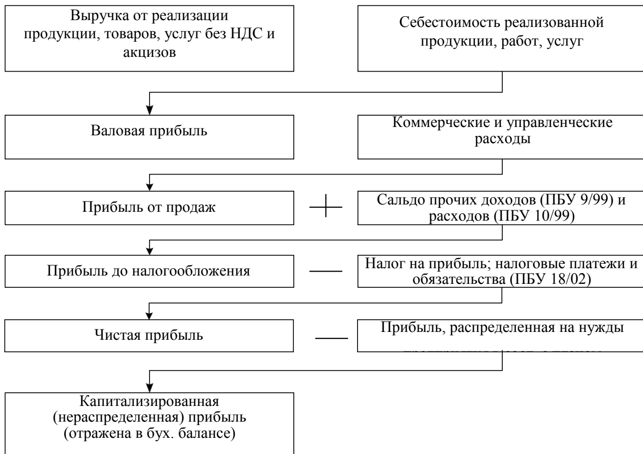
Рисунок 2 - Структурно-логическая модель формирования финансовых результатов

Формируются они последовательно, в соответствии с порядком, представленным на рисунке 2.