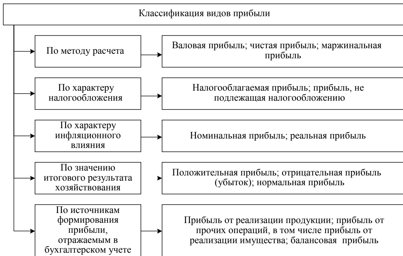
Рисунок 1 – Классификация видов прибыли организации

По данным исследований составлена классификация видов прибыли предприятия, она представлена на рисунке 1.