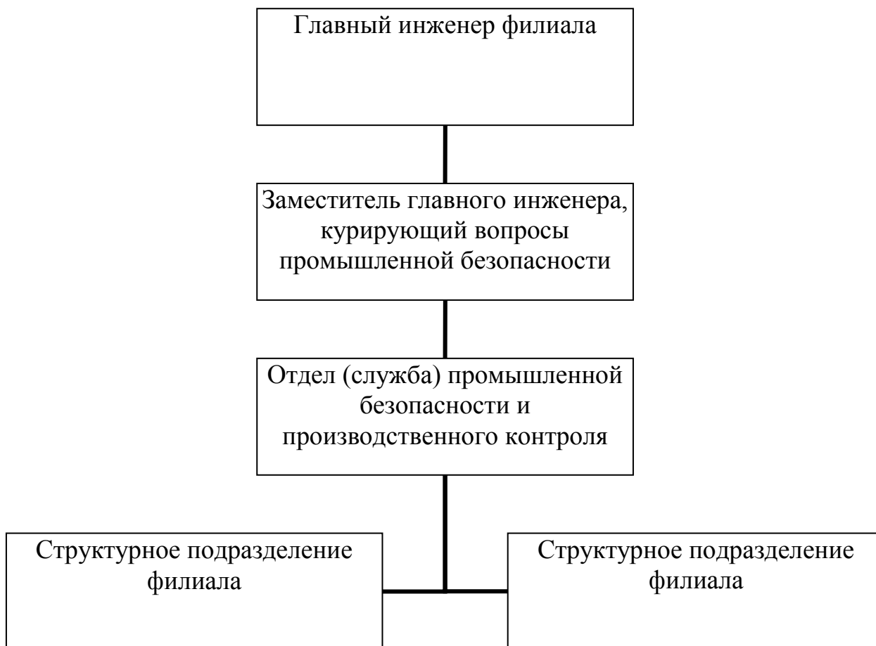
Рисунок 1 - Структурная схема производственного контроля

Основой правильной организации производственного контроля является планирование работы. Учитывая, что организация работы по осуществлению производственного контроля на предприятии (организации) возлагается на отдел (службу) промышленной безопасности.