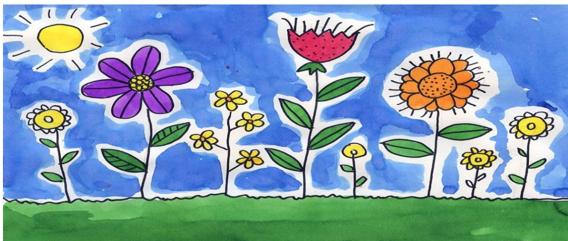
Рисунок 4 – Цветы