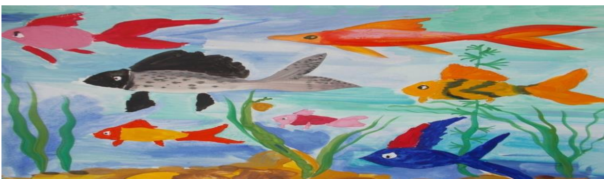
Рисунок 2 – Аквариум