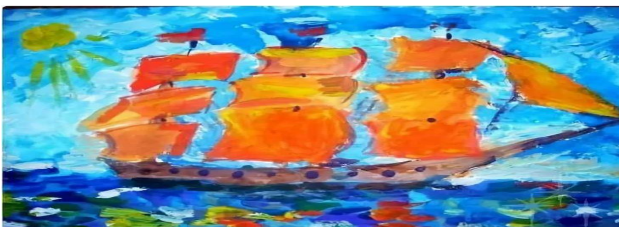
Рисунок 3 – Парусник