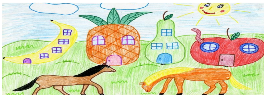
Рисунок 5 – Кони