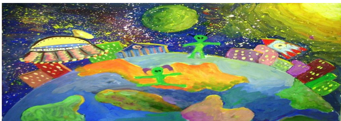
Рисунок 6 – Марс