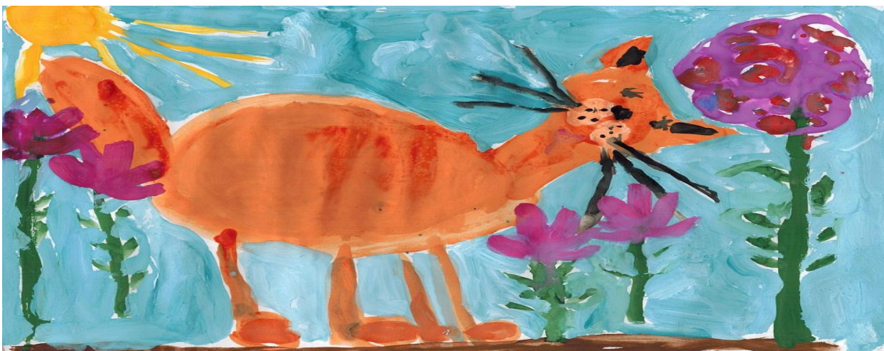
Рисунок 1 – Кот