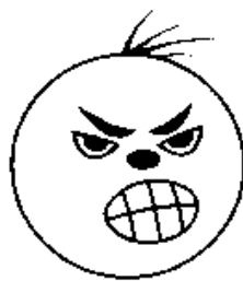
Рисунок 7 – Мой гнев