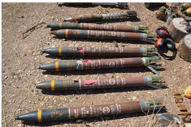
Рисунок А.1 – ракеты иностранного производства

Рисунки с изображением фотоматериалов. Среди обнаруженного – десятки противотанковых ракет, взрывчатые вещества, тонны боеприпасов, стрелковое оружие.