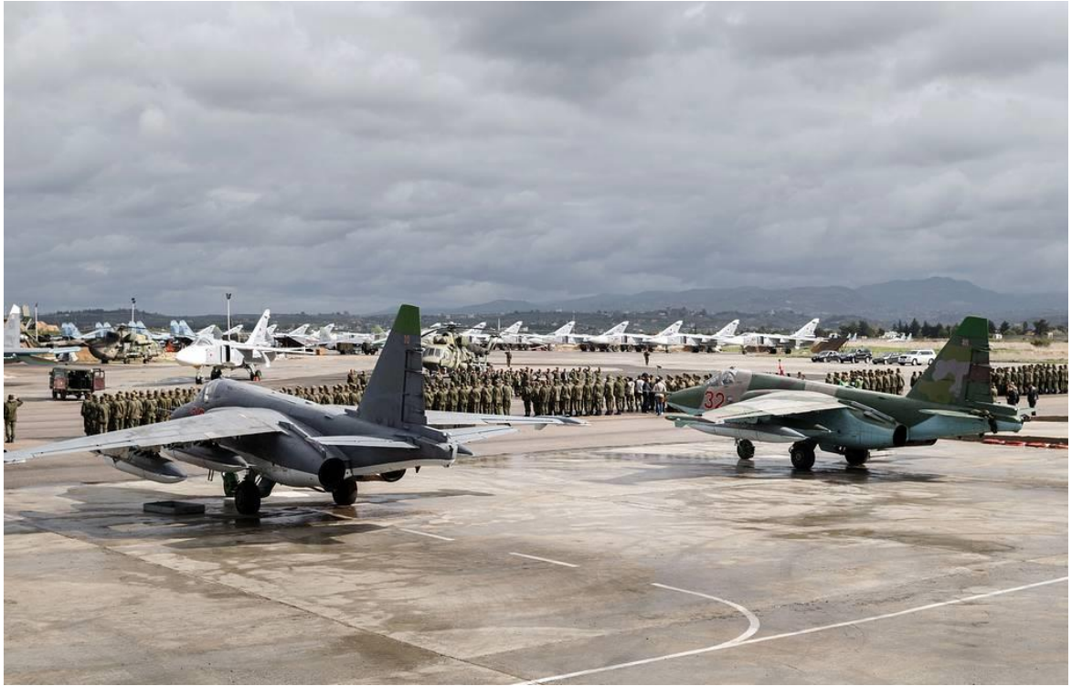
Рисунок Е.1 – Авиабазы «Хмеймим»