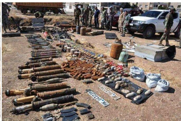
Рисунок А.2 – склад боеприпасов