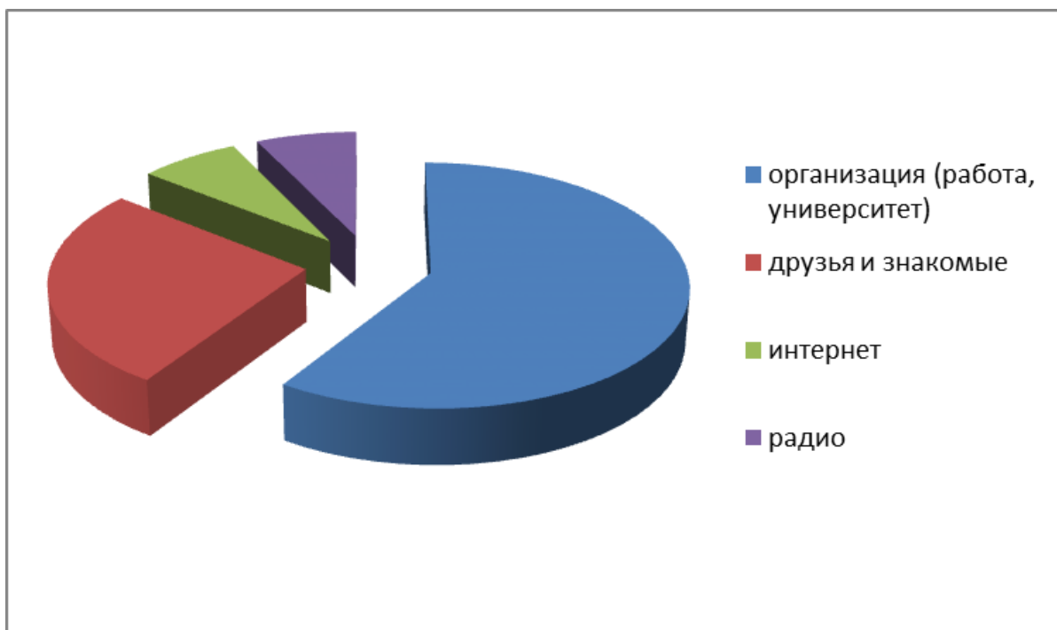
Рис. 1. Молодежные мероприятия, в которых принимали участие респонденты

Далее мы предложили указать источники, с помощью которых молодежь узнает о новостях про различные форумы. Самыми популярными источниками информации оказались организации (работа, университет) – 58%, причем этот вариант ответа выбирают больше молодые люди 70%, чем девушек 46%. Через «друзей и знакомых» информируются 26% респондентов. Примечательно, что как молодые люди (23%), так и девушки (29%). Такие источники как «интернет» и «радио» выбирают 7% респондентов. Девушки чаще, чем молодые люди.