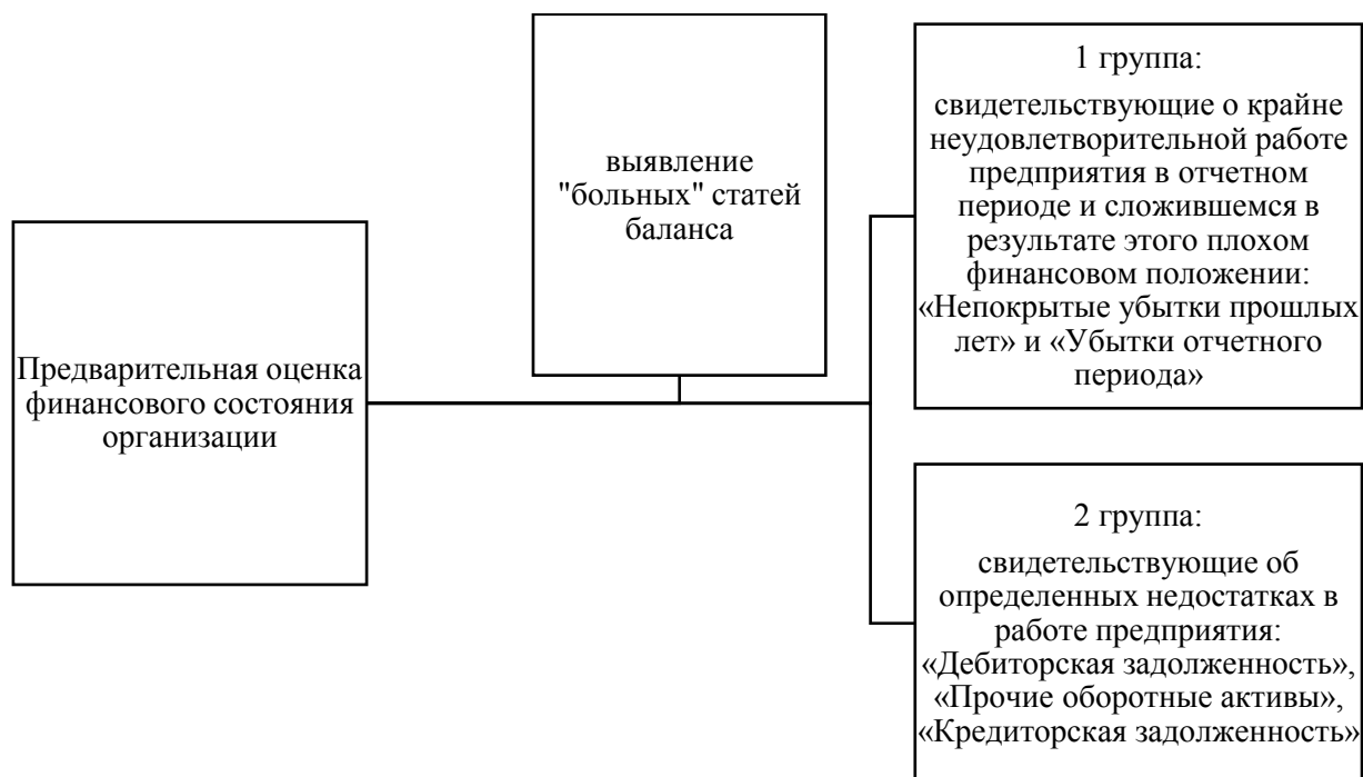
Рисунок 4 – Обнаружение наиболее уязвимых статей бухгалтерского баланса

Бухгалтерский баланс выступает указателем наиболее проблемных зон при проведении предварительного анализа результатов деятельности компании (рисунок 4).