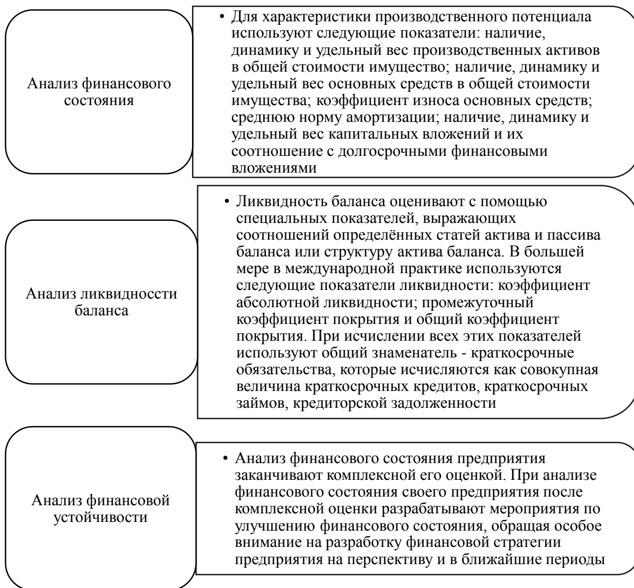
Рисунок 1 – Процедуры, проводимые при анализе эффективности деятельности предприятия

Перечень показателей для более объективного отражения тенденции финансового состояния формируется каждым предприятием самостоятельно.