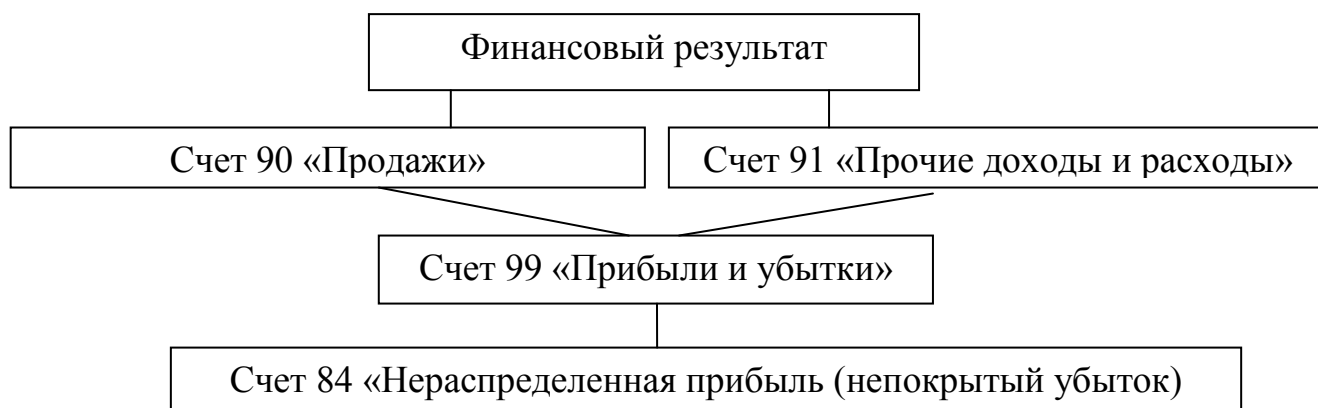
Рисунок 1 - Формирование финансового результата

При образовании итогового финансового результата учитываются показатели прибыли или убытка от основного вида деятельности; прибыли или убытка от прочих видов деятельности; показателей доходов и расходов, влияющих на уменьшение прибыли (налог на прибыль, штрафы, пени). Формирование финансового результата представлено на рисунке 1.