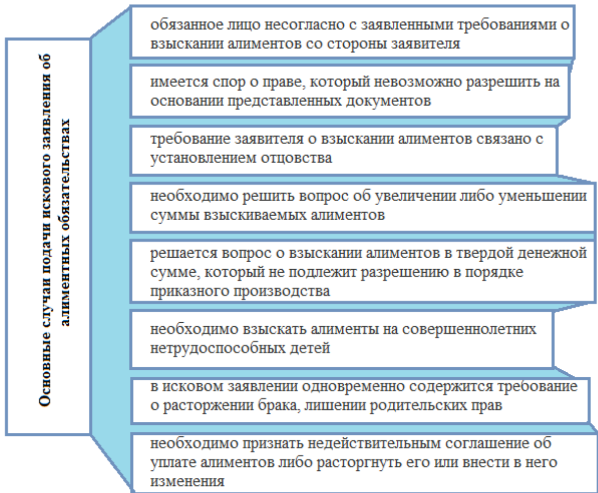
Рис. 2.2. Основные случаи подачи искового заявления об алиментных обязательствах

Требованиям ст. 131 ГПК РФ должно отвечать исковое заявление о взыскании алиментов. Истец в данном случае от уплаты государственной пошлины освобождается. В этом случае, обязанность уплаты государственной пошлины возложена на ответчика. Судья, после осуществления проверки искового заявления всем существующим требованиям, принимает к производству заявление и выносит соответствующее определение о возбуждении гражданского дела.